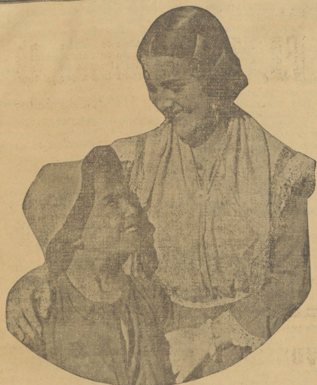
Imperio Argentina, en «Morena Clara», la más bella realización de la famosa y centenaria comedia de Quintero y Guillén, que muy pronto se estrenará en Olympia