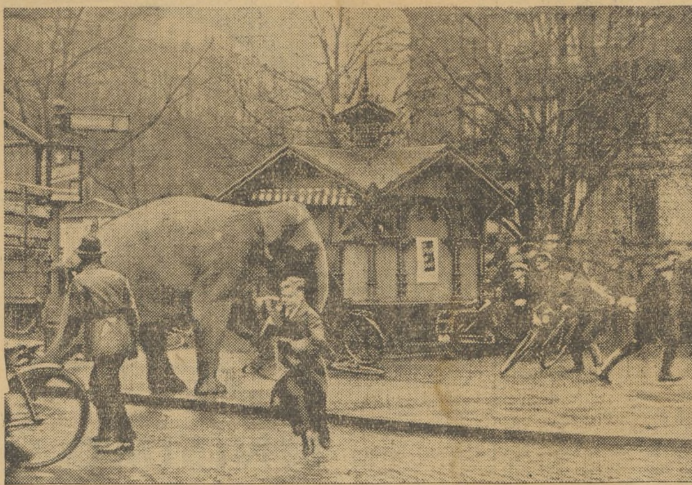
Por las calles de Hamburgo se ha dado en estos días un espectáculo pintoresco. Un elefante del Circo Sarrañani se escapó, produciendo gran pánico, aunque sin consecuencias.