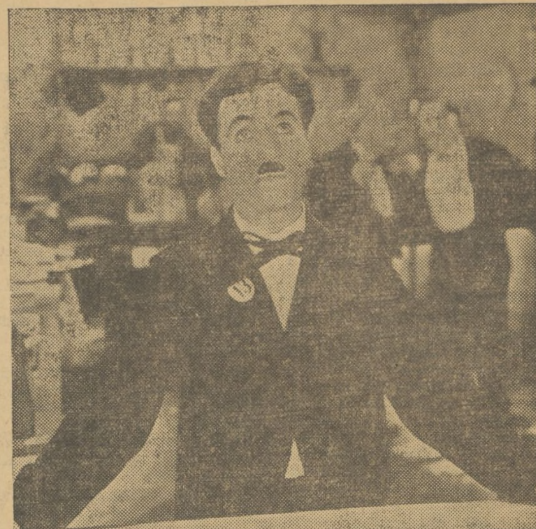
Charlie Chaplin, el genial Charlot, protagonista de su más reciente producción «Tiempos modernos», que ya ha causado la natural expectación entre los aficionados y que muy pronto se estrenará en el Metropol