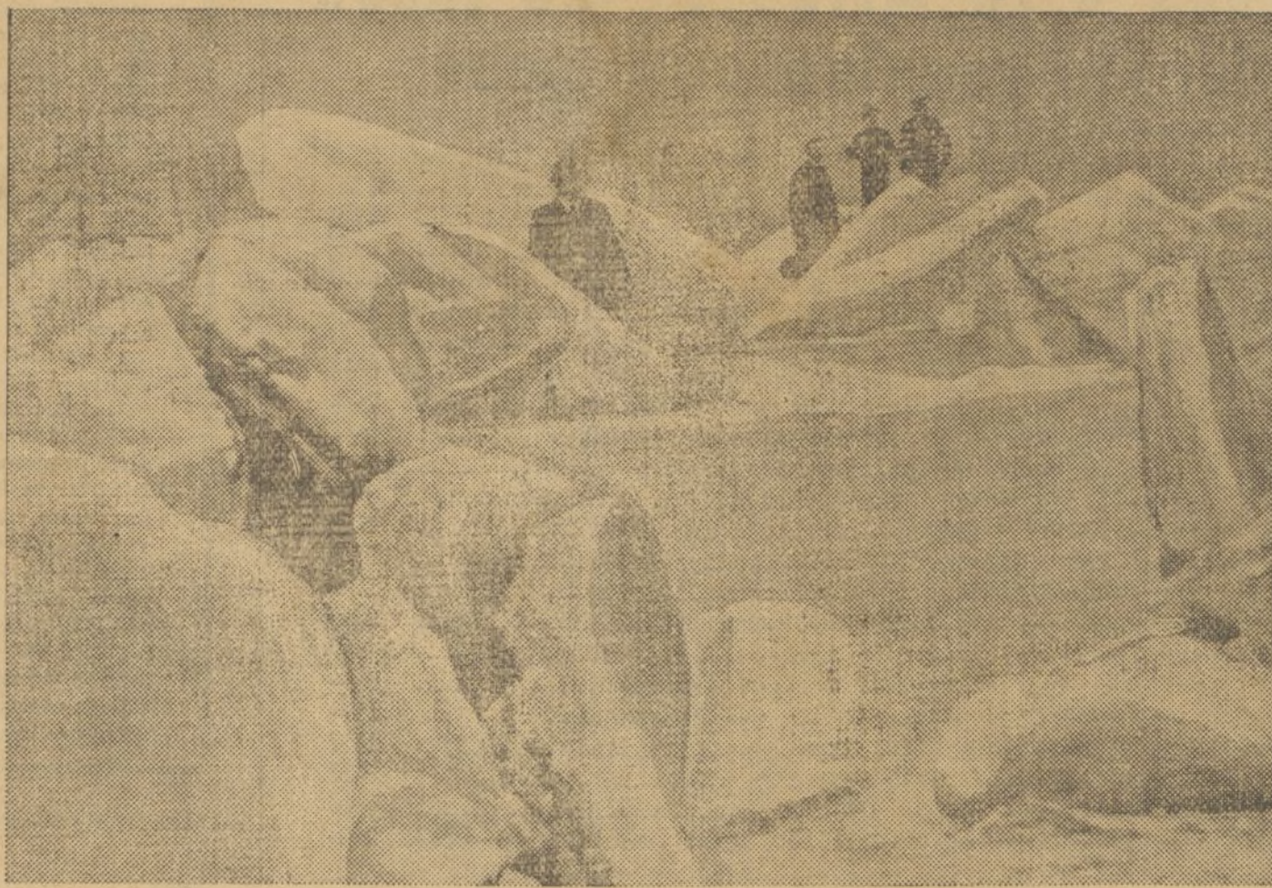
Bloques de hielo que van sobre el Ohio, están amenazando un sector importante de la población de Vaport (Virginia), Estados Unidos. En una extensión de veinte kilómetros, el hielo se agrupa en cantidades grandes y es empujado a las orillas del río, llenas de viviendas que han sido desalojadas.