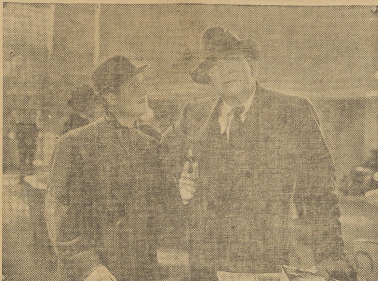
Victor Mc. Laglen y Edmund Lowe, en una interesante escena de la película «Un par de detectives», que mañana estrena el suntuoso Capitol