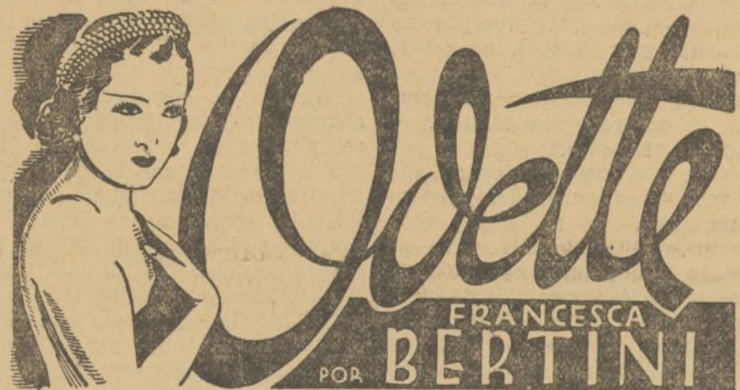
Emocionante producción de esta gran artista; la mujer de elegantes toillettes VEALA EN ESTE SALON