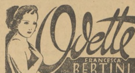
Película cumbre en la que reaparece esta gran actriz