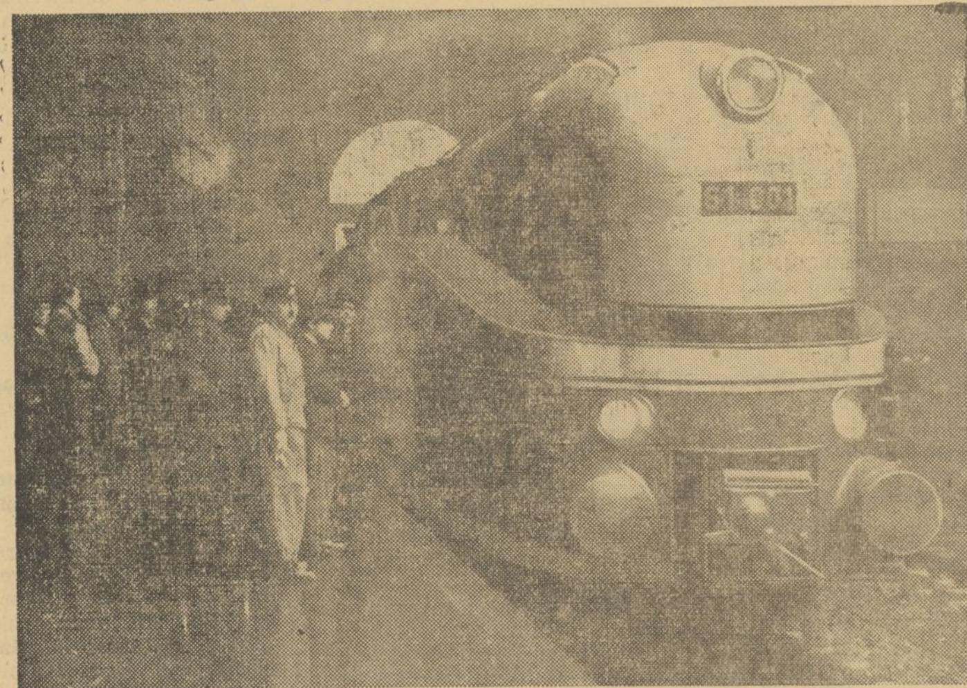
Este es el nuevo tren que ha comenzado a prestar servicio entre Berlín y Hamburgo y que marcha a la velocidad fantástica de 175 kilómetros a la hora. La marcha media de todo el trayecto es de 160 a la hora, cubriendo los 310 kilómetros en algo menos de dos horas.