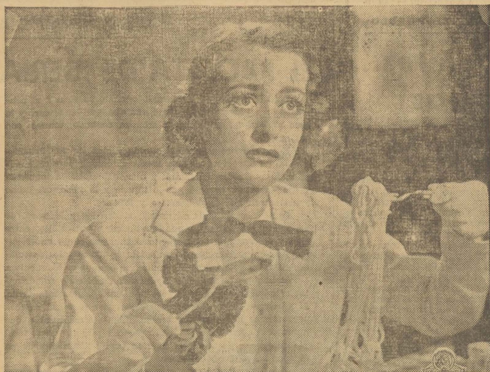
JOAN GRAWFORD, la admirable estrella de la pantalla, protagonista de «VIVO MI VIDA», película que mañana estrena el CAPITOL