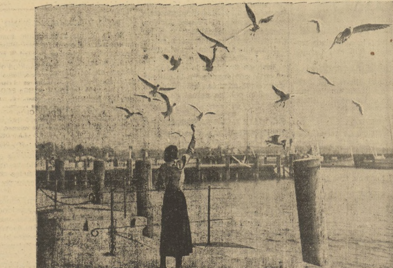
Las gaviotas de este puerto holandés, están recibiendo satisfechas el obsequio de esta amable señorita