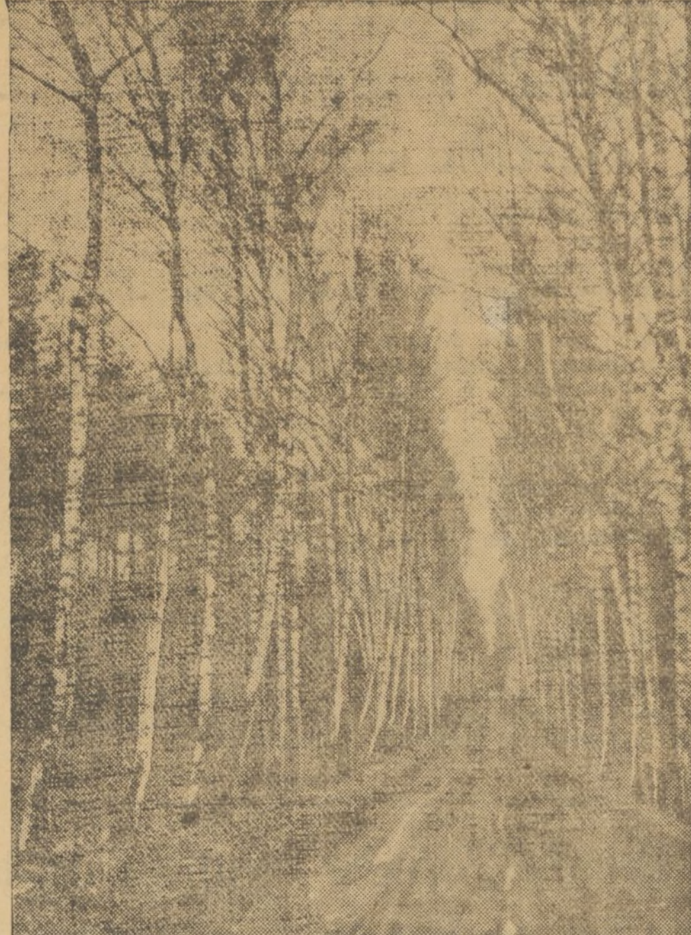
Un paisaje de las primicias de la Primavera, en nuestra provincia

Concluye la Prensa italiana diciendo que «la directriz central de nuestro despliegue permite el tránsito de vehículos motorizados hacia Jijiga, que pri-