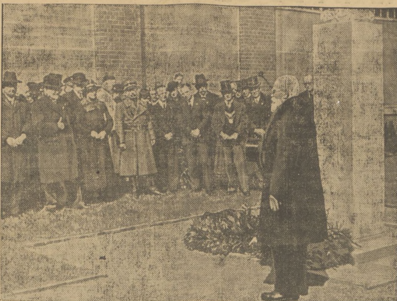
Con la asistencia de todas las personalidades del mundo en radiología, radium y rayos Roentgen, ha sido inaugurado en el Hospital de San Jorge, de Hamburgo, el monumento a las víctimas de esta ciencia. Como decano, el profesor Beclere, francés, pronunció un discurso en la inauguración