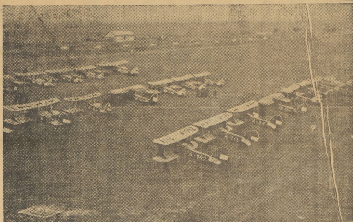
Una vista en los terrenos del campo de aviación de Viena, de la primera escuadrilla aérea militar de Austria