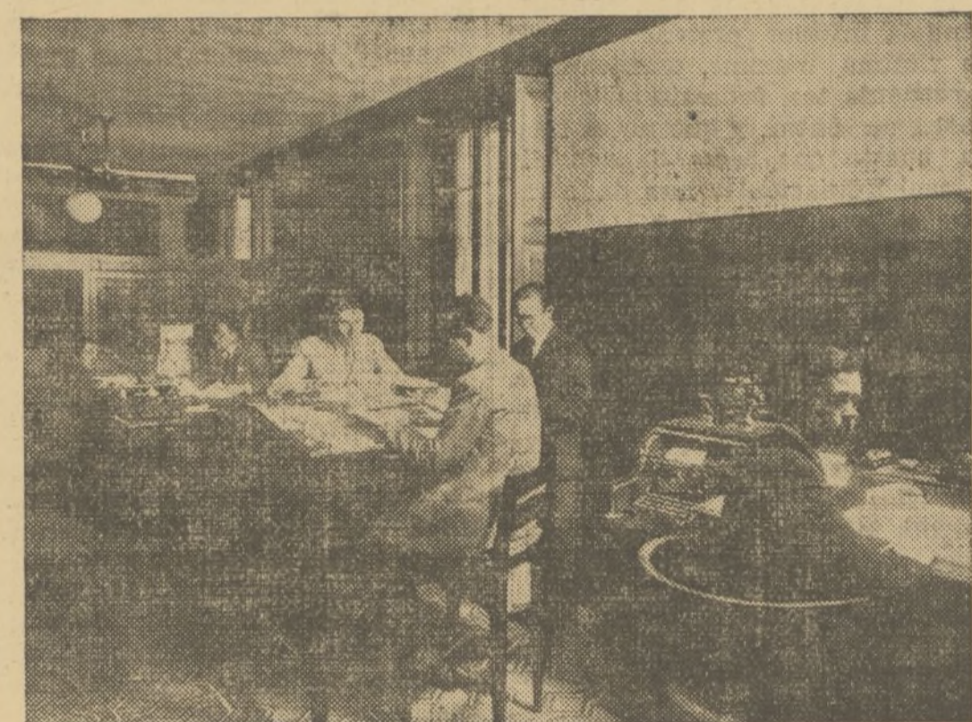
DETALLE DE LAS OFICINAS

un hombre superdotado de inte- ligencia, entusiasmo y corazón.