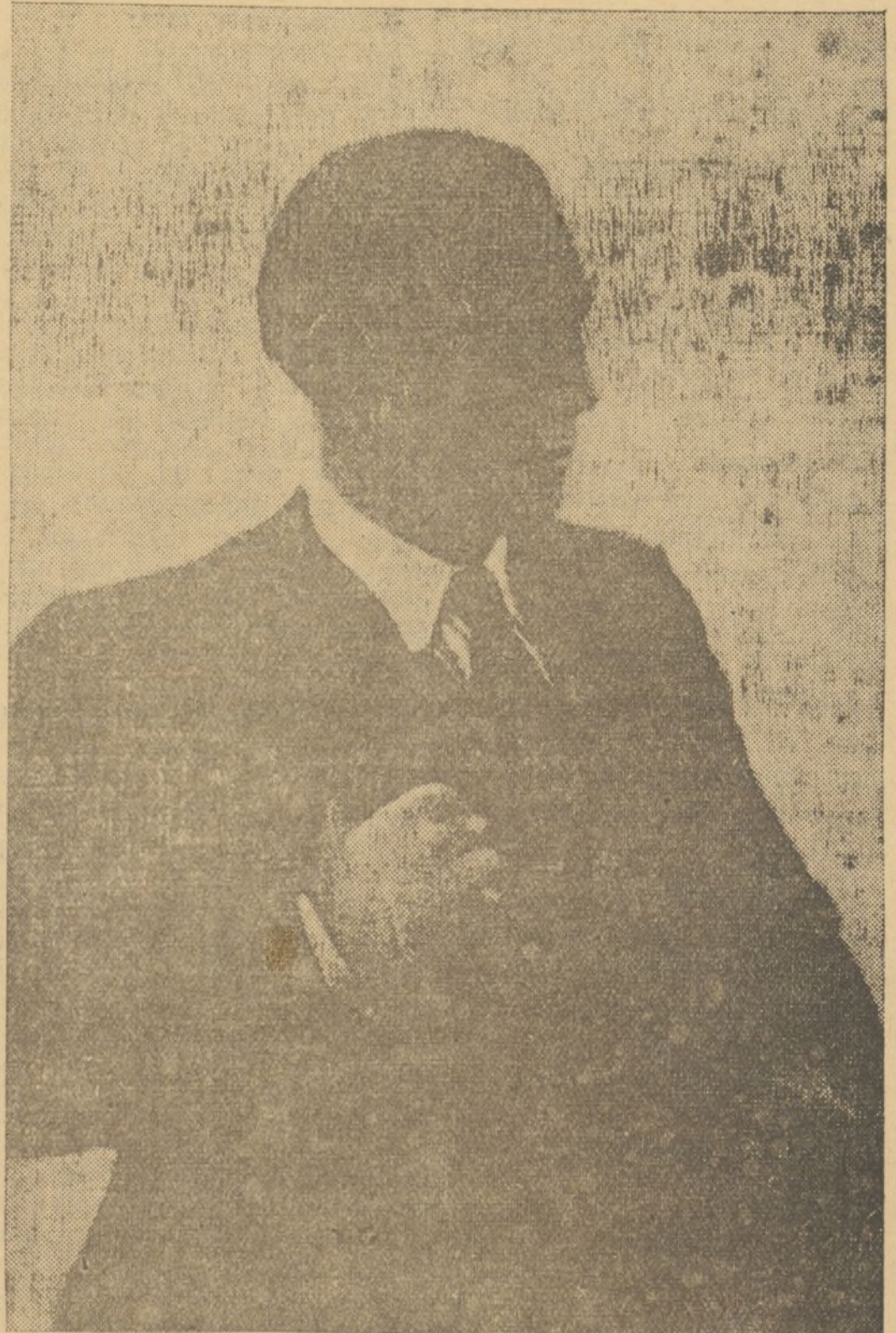
Juan Ribas, el eminente tenor, está alcanzando extraordinarios éxitos en la impresión gramofónica. Sus canciones «Única ilusión» y «Ayelina», son una maravilla de arte, pues en ellas demuestra, como en sus actuaciones teatrales, sus excepcionales dotes de cantante.