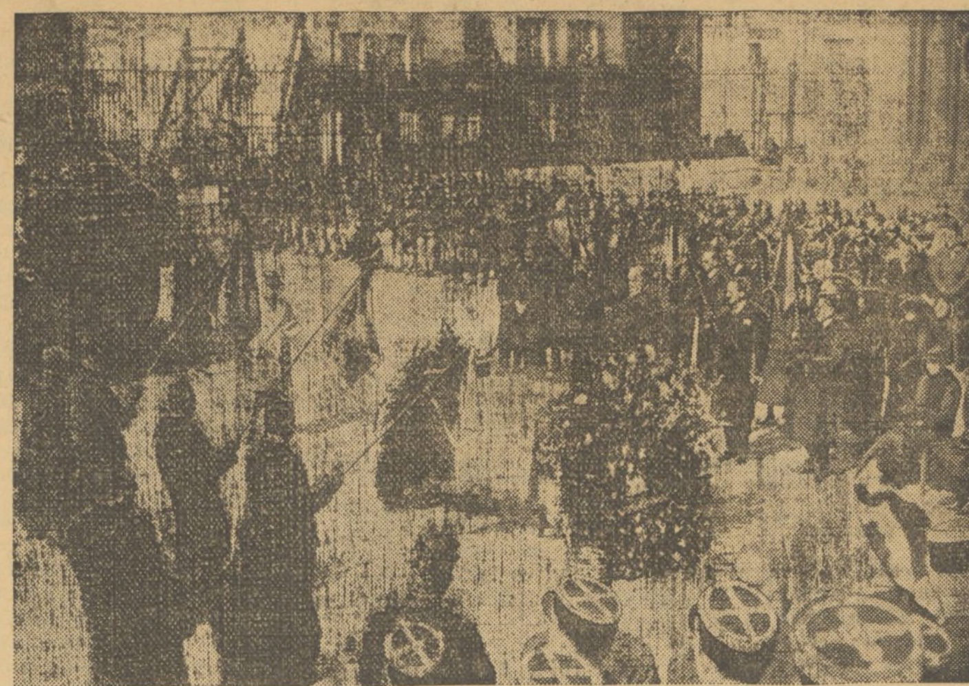
En Val-de-Grace, en las cercanías de París, con la participación del ejército, ha tenido lugar el entierro del general Estienne, inventor de los carros de asalto y tanques. A la ceremonia asistió el mariscal Petain, que está leyendo aquí su discurso.

tros en una barriada extrema de Barcelona.