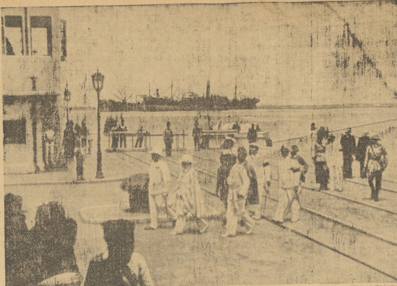
Haile Selassie I, en el momento de desembarcar en el muelle de Haifa (Palestina). Las autoridades inglesas le rindieron honores de emperador, por lo que ha protestado el representante de Italia en Palestina

EL PRESENTE NUMERO HA SIDO VISADO POR LA CENSURA