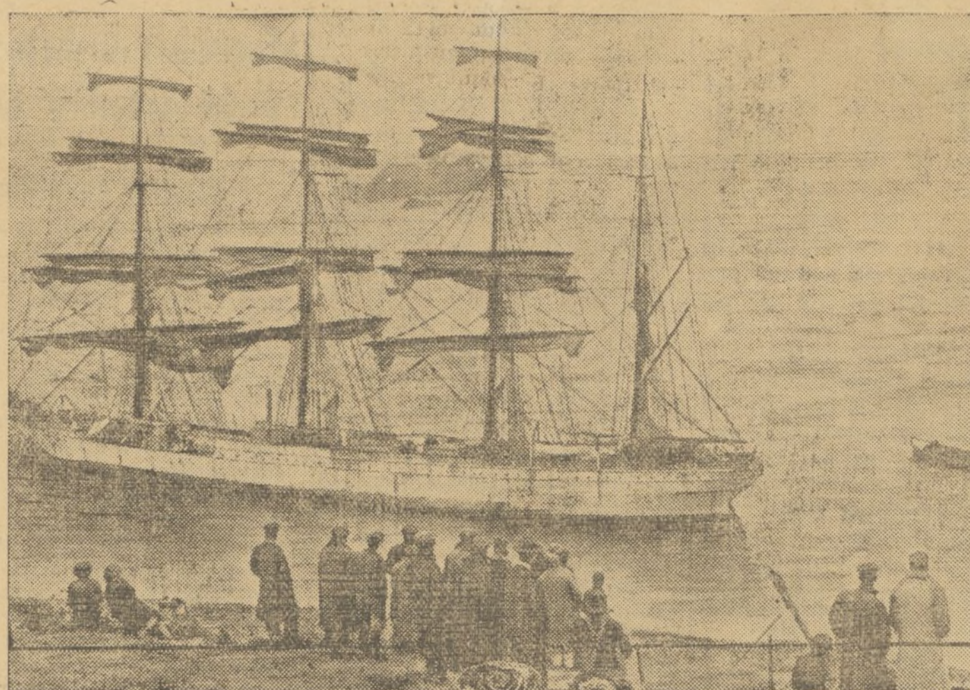
Hasta hace poco, el velero "Cecilia" de cuatro palos, era considerado como el mayor del mundo. Desplazaba 3.111 toneladas y todavía a pesar de sus años estaba en servicio activo. En las costas inglesas de Salcombe, ha embarrancado sobre un banco de arena y el buque se ha dado ya por perdido