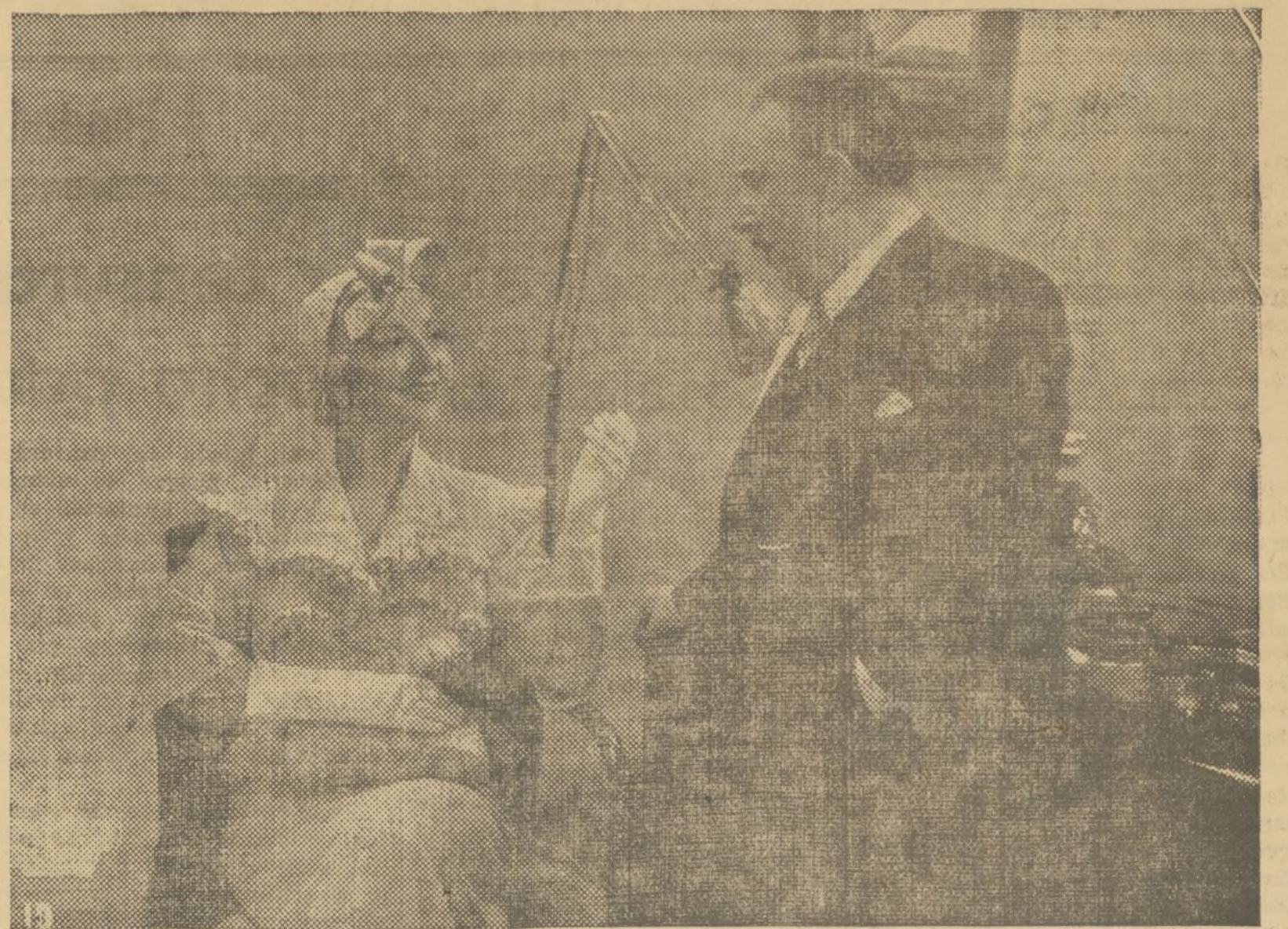
Pasará el tiempo y entre los buenos aficionados perdurará el recuerdo de «El bailarín y el trabajador», la nueva película española y la consagración de su director, Luis Marquina