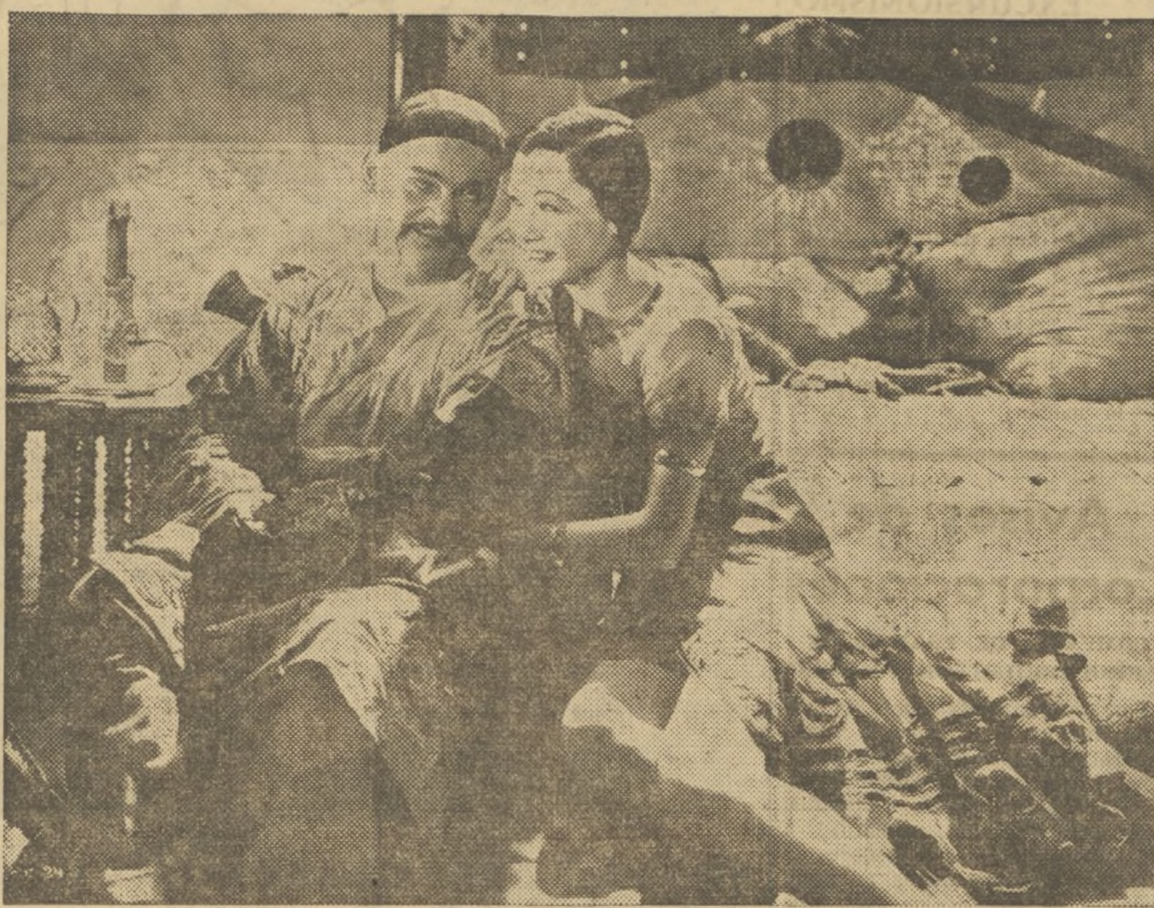
ANNA MAY WONG Y FRITZ KORTNER EN LA MARAVILLOSA SUPERPRODUCCION "CHU CHIN CHOW (ALI BABA O LOS CUARENTA LADRONES)", QUE HOY ESTRENA EL Suntuoso CAPITOL

George Robey, que hizo el Sancha Panza de la versión inglesa Don Quijote, monta en "Chu-Chin Chow" el mismo asno que utilizó en aquella película. Anna May Wong odia el té de la China; lo