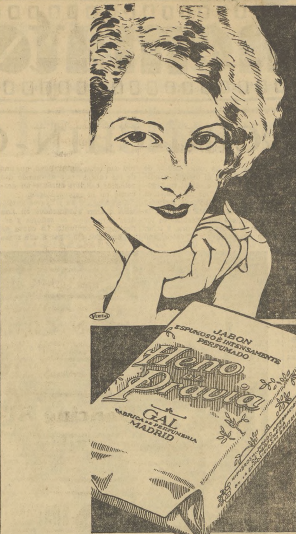
PERFUMERIA GAL. - MADRID. - BUENOS AIRES

A los poseedores de los referidos permisos faltos de dichos visado y sellado, se les concede un plazo de diez días naturales para su cumplimiento, transcurrido el cual, todo vehículo automóvil de la citada categoría que se encuentre circulando sin dichos requisitos, será sancionado conforme a lo dispuesto en el segundo concepto del párrafo a) del artículo 106 del vigente Código de la Circulación.