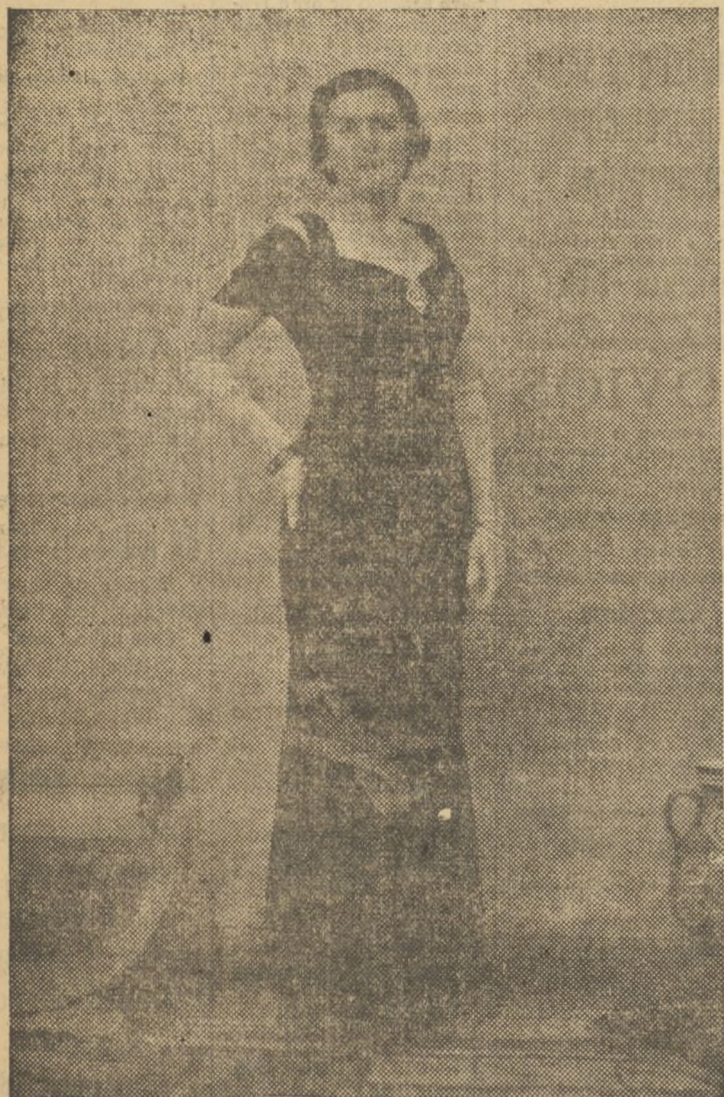
NUESTRA BELLA MISS VALENCIA ES UNA ESCULTURAL MUJER, ARROGANTE Y GRACIOSA AL PROPIO TIEMPO

por su desmedida afición al bordado, donde realiza verdaderos primores.