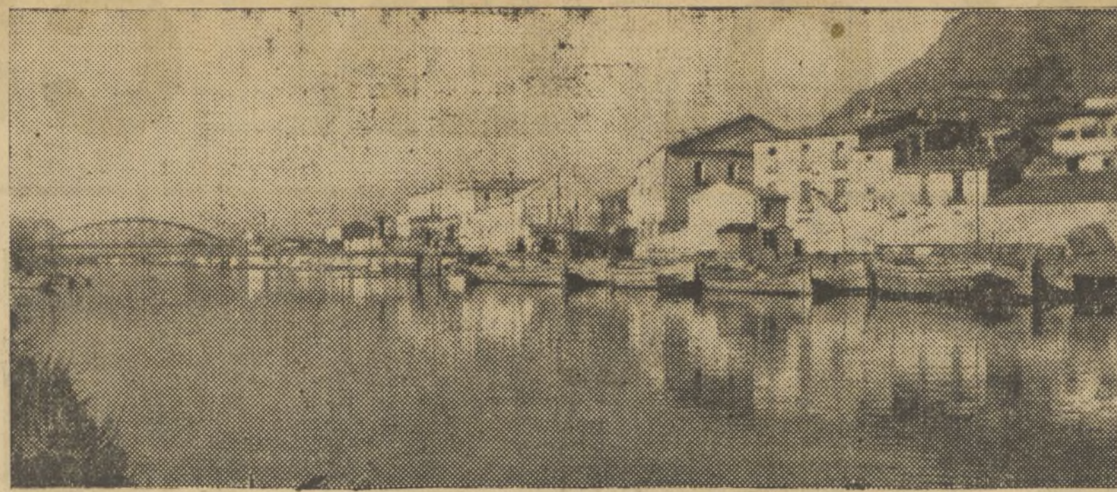
MUELLE EN EL RIO JUCAR