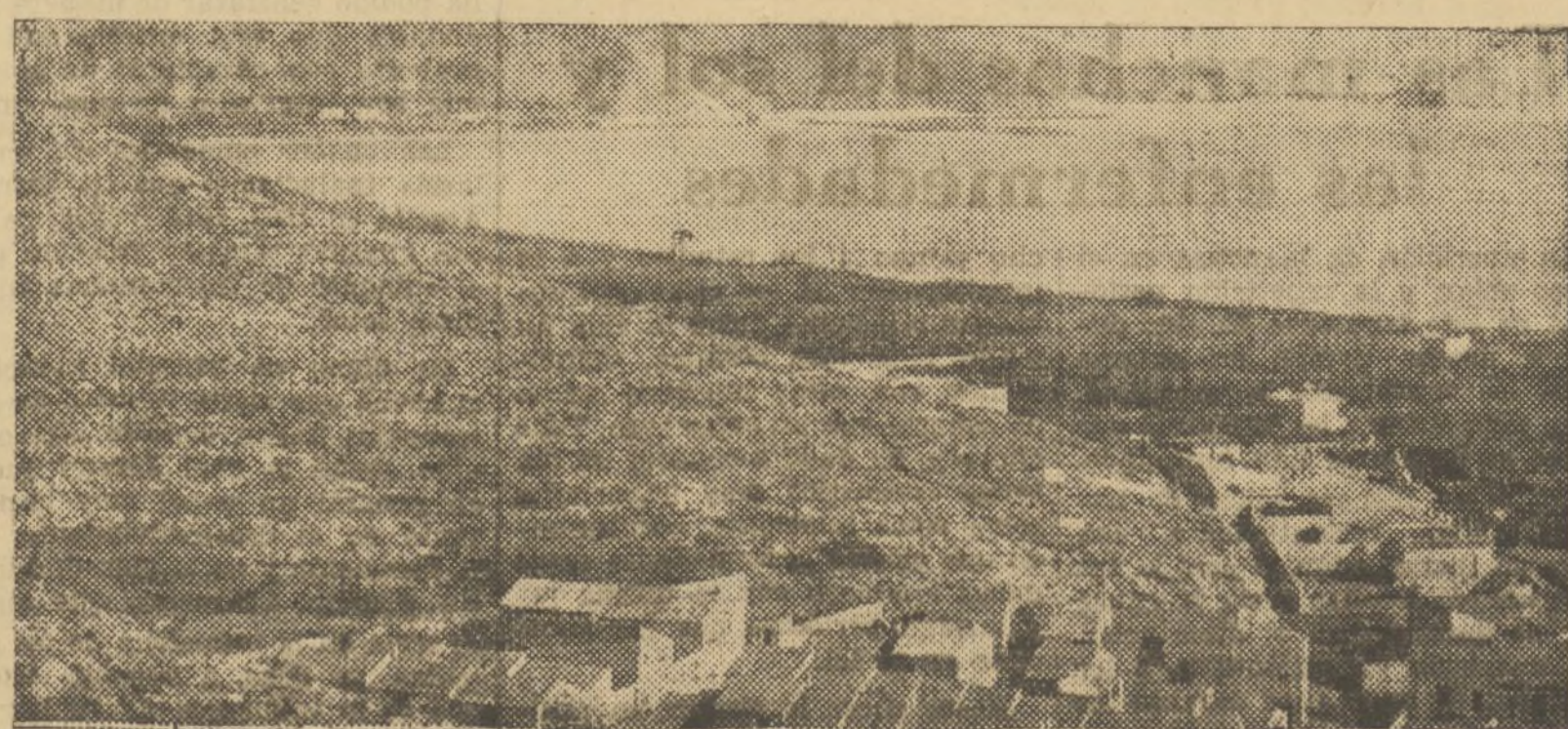
PLAYA Y FARO, DESDE EL CASTILLO

Nuestra felicitación a todos, singularmente al Alcalde y nuestra enhorabuena al pueblo de Cullera por tener la suerte de estar regido por gestores de tanto prestigio y de tan gran amor e interés por el progreso de esta ciudad digna de figurar entre las más destacadas de España.