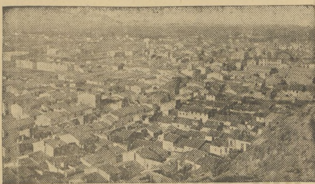
VISTA PARCIAL DE CULLERA

table galardón artístico, habiendo obtenido ambas corporaciones—Ateneo Musical y Santa Cecilia—valiosos premios en el Certamen Regional de Valencia. Pero singularmente la Banda Musical Cellerana ha logrado primeros premios internacionales en nuestra vecina República francesa. Los dos centros musicales tienen realizada una labor cultural muy digna de encomio, apartando a la juventud de los vicios propios de su edad,