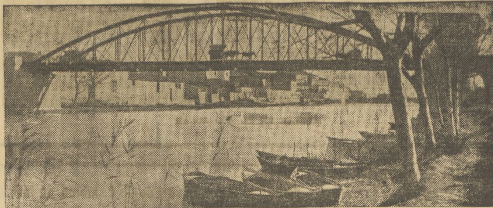
PAISAJE DEL RIO JUCAR