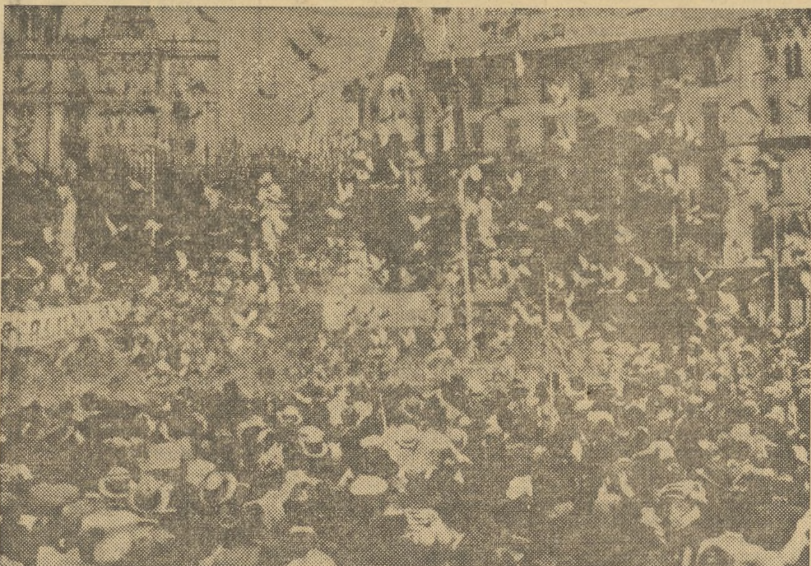
EL IV ANIVERSARIO DE LA REPUBLICA EN BARCELONA, CON ASISTENCIA DEL MINISTRO DE OBRAS PUBLICAS SEÑOR GUERRA DEL RIO. MOMENTO EN QUE SE SOLTARON MILLARES DE PALOMAS