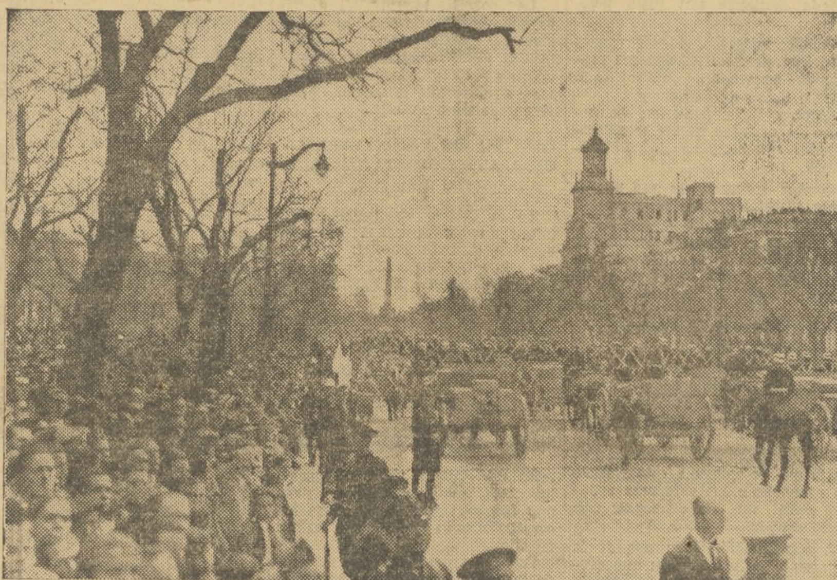
EN MADRID.—ASPECTO DEL PASEO DE LA CASTELLANA DURANTE EL HOMENAJE AL EJERCITO EN EL 14 DE ABRIL.