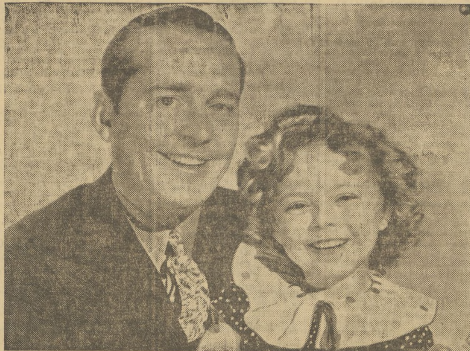
LA NOVIA DE LOS «PEQUES», SHIRLEY TEMPLE, CON JAMES DUNN, QUE EL PROXIMO SÁBADO, EN EL CINE CAPITOL, DELEITARA AL PÚBLICO VALENCIANO EN SU NUEVA PRODUCCIÓN «GRACIA Y SIMPATÍA»