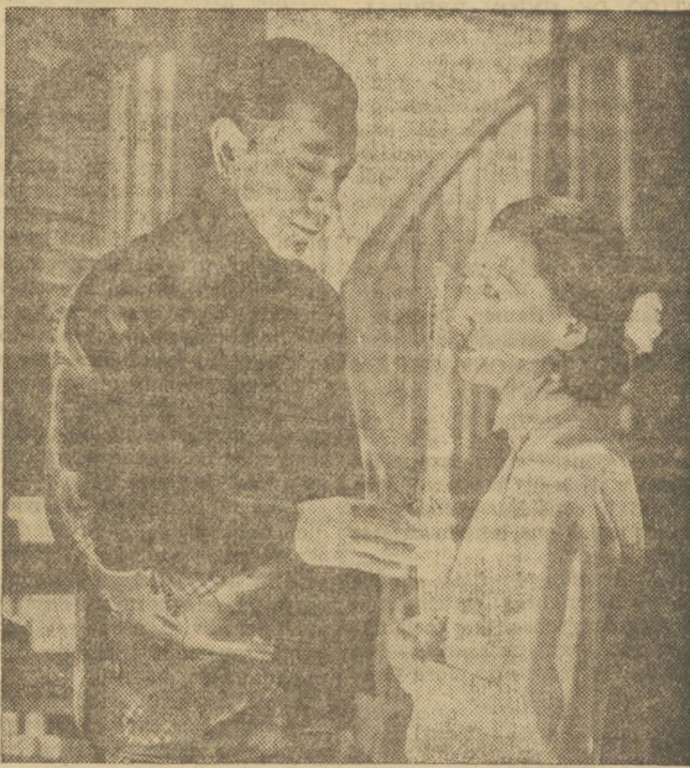
GEORGE RAFT Y ANNA MAY WONG EN UNA ESCENA DE «NOCHES DEL SUBURBIO»

A pesar de cuanto pueda decir la gente acerca de mí, sigo yo siendo el mismo y obrando como de costumbre.