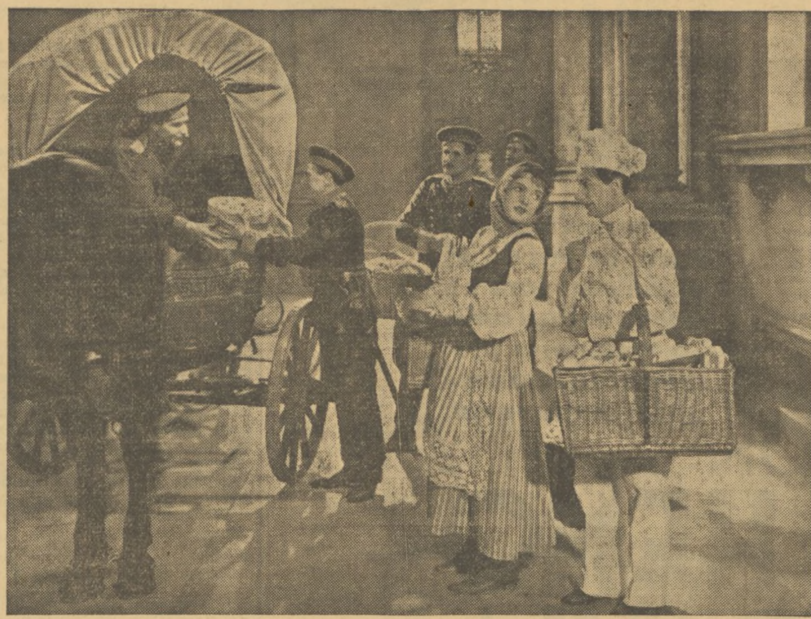
UNA ESCENA DE LA PRODUCCION ALEMANA «FIESTA EN PALACIO», QUE LA VALENCIANISIMA CIFESA PRESENTARA TODAVIA EN LA ACTUAL TEMPORADA

La creación que ambos actores hacen en este film distribuido por Cifesa, es indudablemente un allende más, con el que consigue un triunfo la conocida marca inglesa British International Pictures.