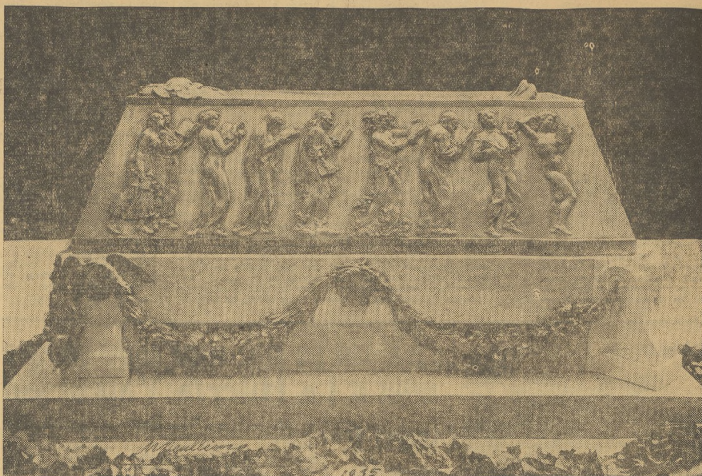
UN ASPECTO DEL SARCOFAGO QUE GUARDARA LOS RESTOS DE BLASCO IBÁÑEZ