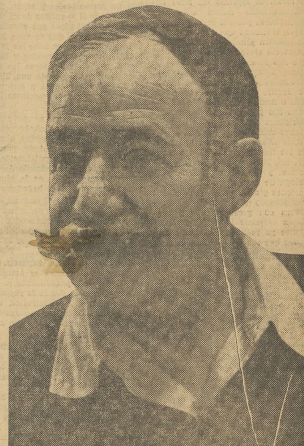
DON MARIANO BENLLIURE, GENIO DE LA ESCULTURA, QUE INMORTALIZA EN EL BRONCE LA OBRA DE BLASCO IBANEZ

Son características de la juventud, la seguridad del trazo, la robustez de las figuras, la valentía y el atrevimiento del artista al resolver fácilmente los problemas de la transparencia de las telas, la movilidad de las figuras, el alma de las mismas y todo eso ha resuelto don Mariano Benlliure y es que a más de ser un artista