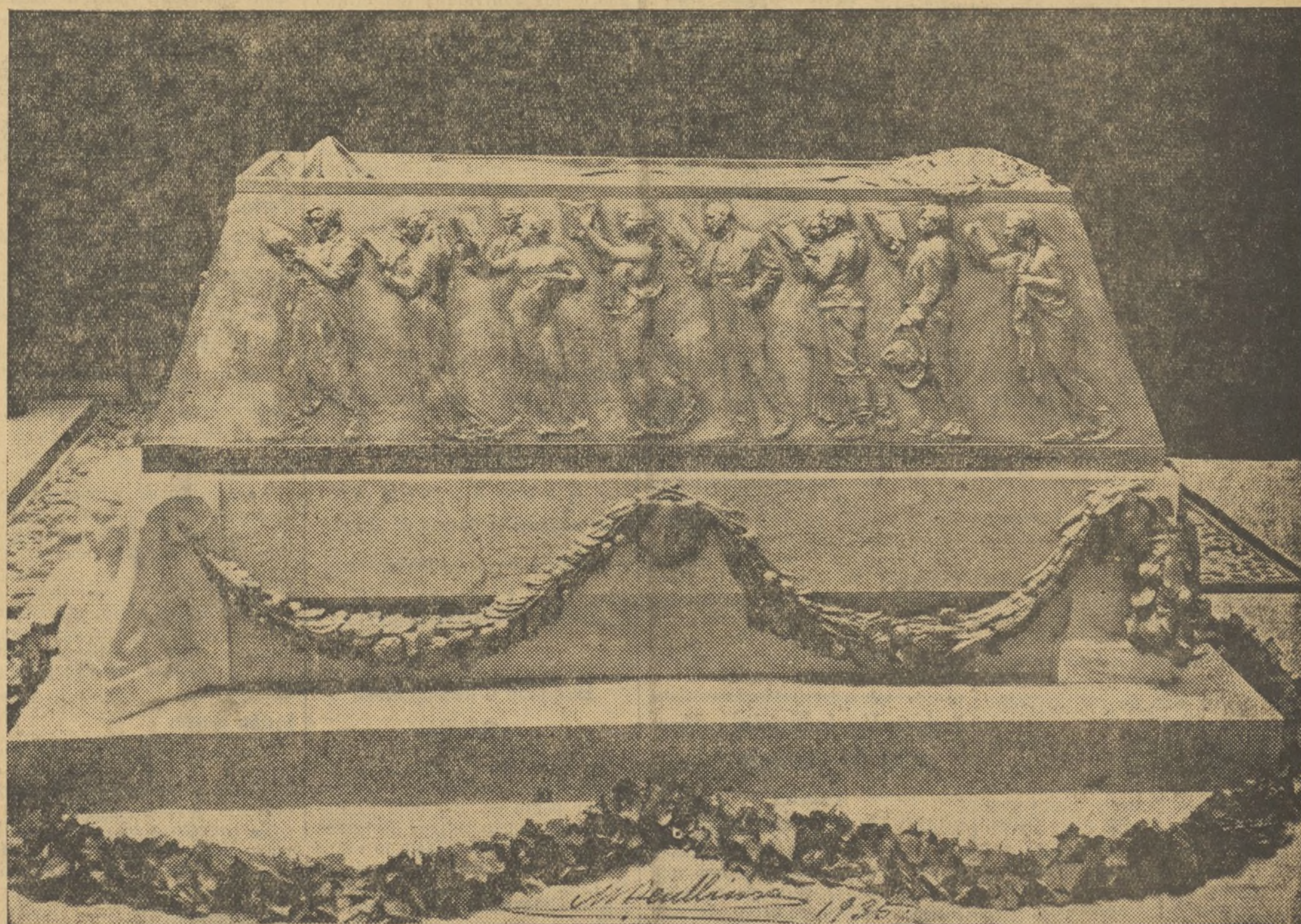
NUEVA FASE DE LA OBRA ESCULTORICA DE MARIANO BENLLIURE, DONDE SE PRECIAN LOS MARAVILLOSOS ALTORRELLE, VES QUE EVOCAN LAS OBRAS DEL MAESTRO

El Alcalde manifestó a los informadores municipales que otra vez se habían producido averías en la luz en la Avenida del 14 de Abril, y que saliendo al paso de las quejas que se pudieran formular, había dado las oportunas órdenes para que fuesen arregladas, y al objeto han estado durante el día de ayer trabajando los obreros de la brigada de Alumbrado.