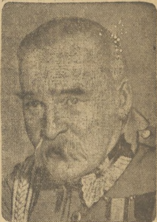
EL MARISCAL PILSUDSKI

Horas después de marchar el señor Laval, falleció el mariscal Pilsudski. La noticia nos ha sorprendido redactando esta nota.