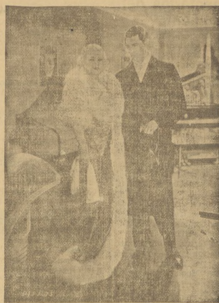
LA OPULENTA Y CIBREANTE ESTRELLA MAE WEST EN UNA ESCENA DE LA PELÍCULA «NO SOY NINGUN ANGEL», QUE EL LUNES PROXIMO ESTRENARA EL Suntuoso CAPITOL

Fuera o no así madame Dubarry, la crítica española ha estado de acuerdo en que de cuantas protagonizaciones se han hecho de la famosa mujer, ninguna como la de la simpática Dolores del Río.