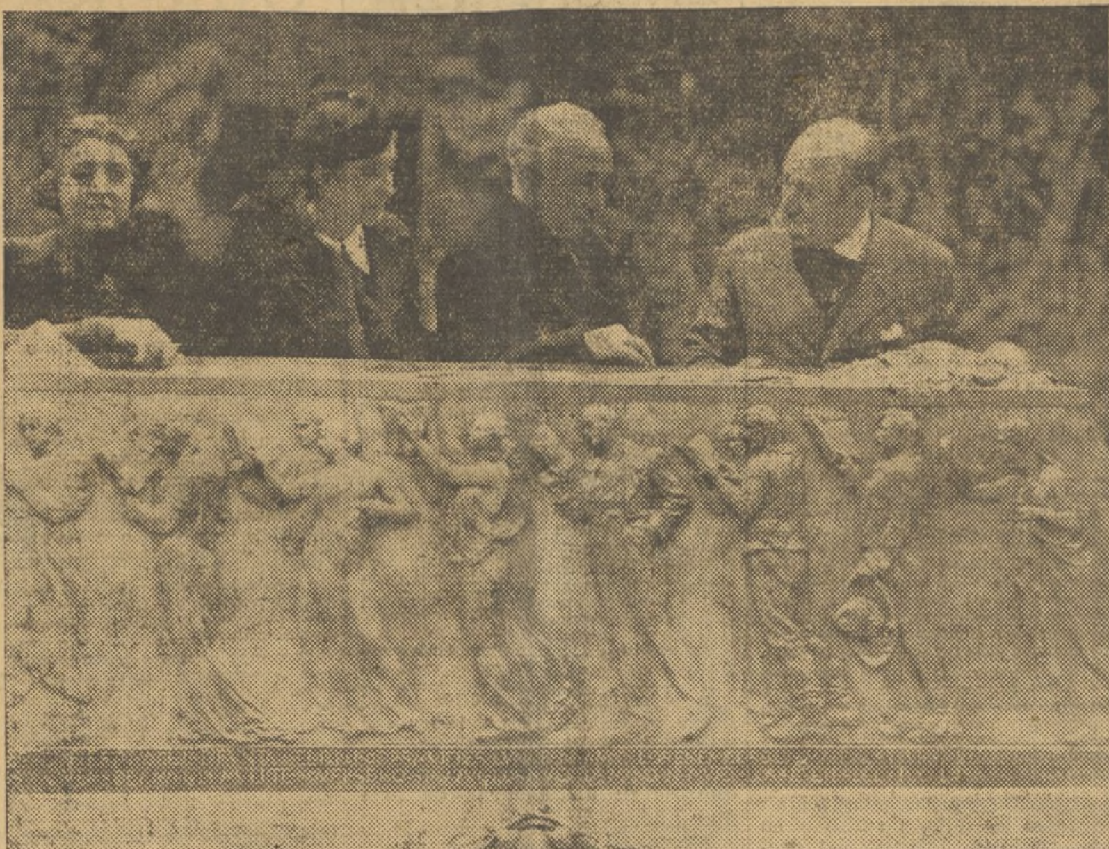
SU EXCELENCIA EL PRESIDENTE DE LA REPUBLICA, CONTEMPLANDO LA ESTATUA YACENTE DE BLASCO IBAÑEZ, ENVUELTA EN TENUE SUDARIO, REALIZACION FORMIDABLE DE UN PROBLEMA ESCULTORICO, RESERVADO UNICAMENTE A UN ARTISTA GENIAL, COMO DON MARIANO BENLLIURE