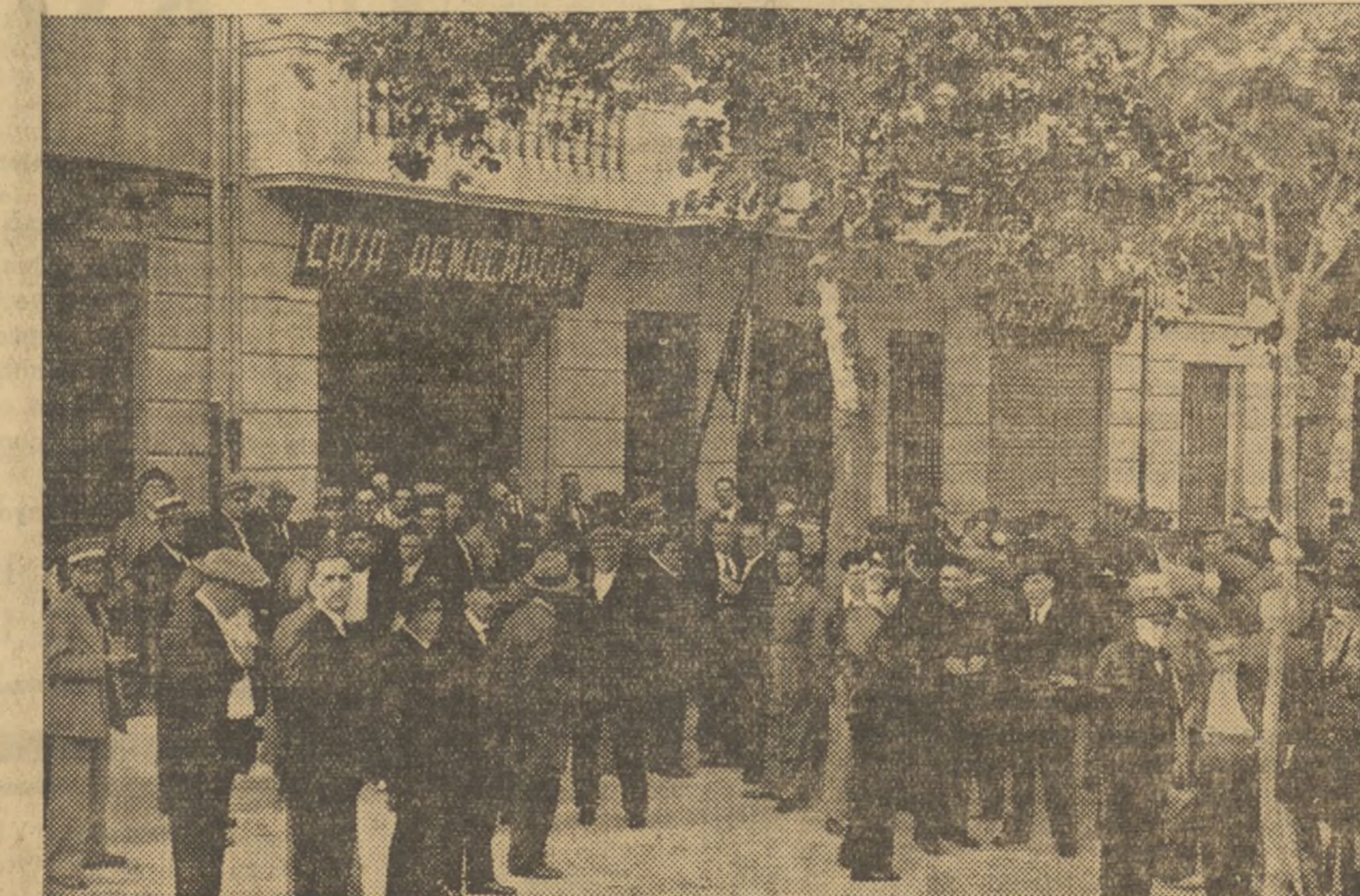
Nuestros correligionarios esperando la llegada de los oradores para la inauguración de la Casa de la Democracia de la Vega Alta.