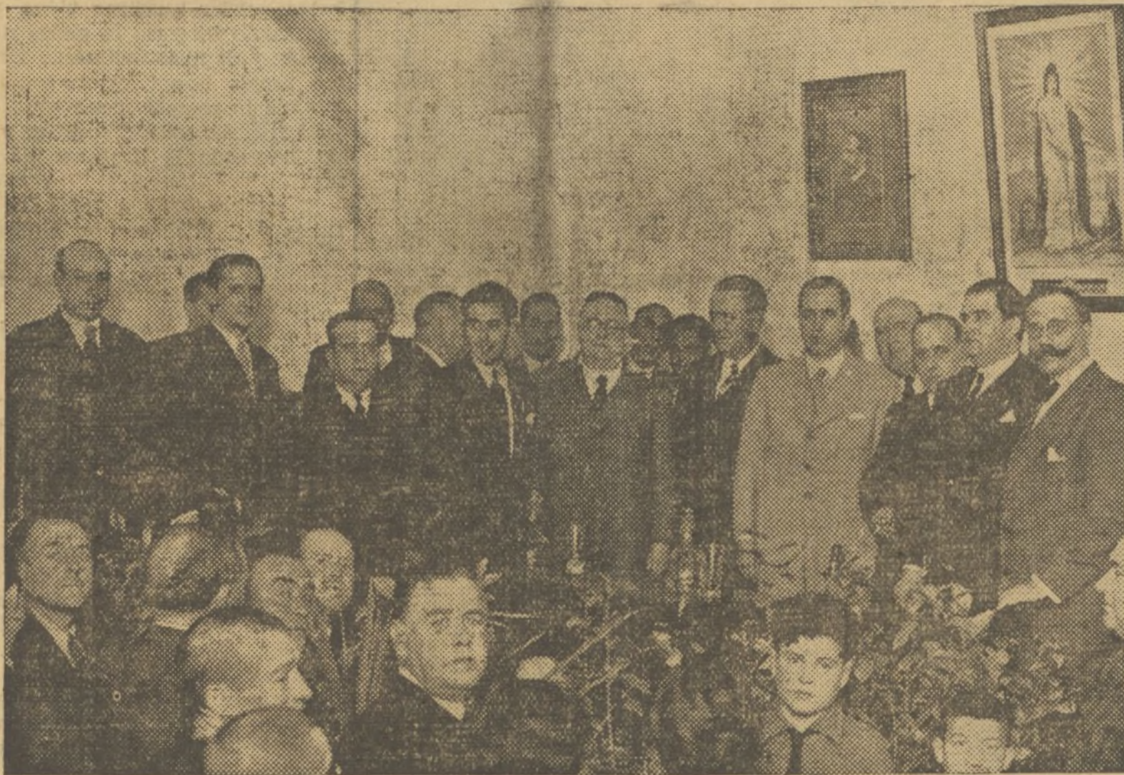
La presidencia del acto y autoridades del Partido, en la inauguración del nuevo Centro.

oyentes, profundamente emocionados, demostraban con su sola expresión la importancia de lo que se trataba, y así fué corriendo el reloj, sin que nadie se diera cuenta hasta que bien cerca de las nue-