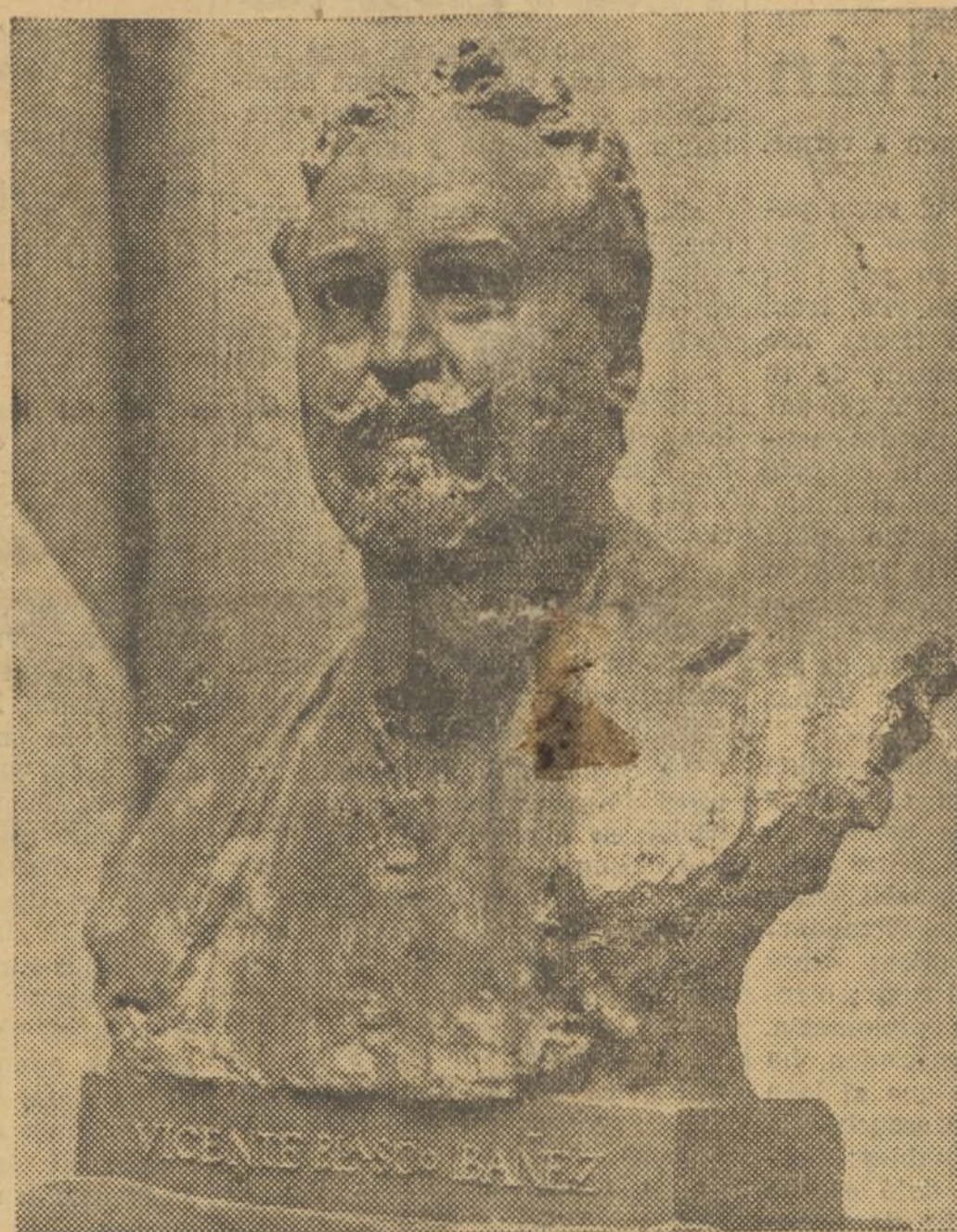
Busto de Blasco Ibáñez, maravillosa producción de Mariano Benlliure