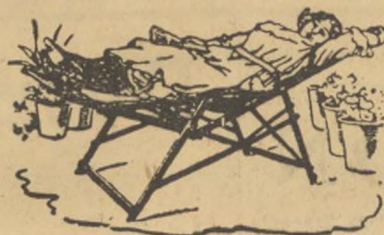
HAMACA PATENTE NÚMERO 89.533

Antología Universal. Es una historia de la literatura, profusamente ilustrada con cuadros de los museos. Tomos 28 por 23.