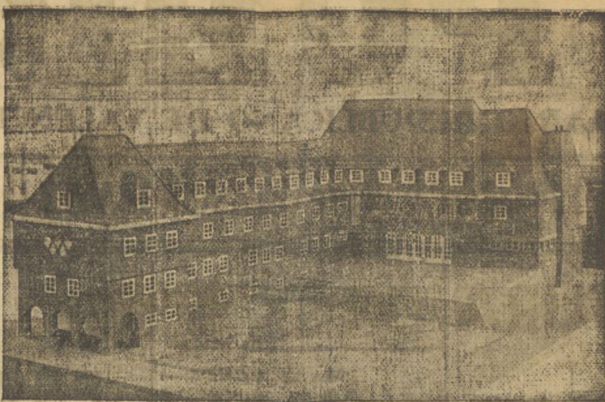
EN KIEL SE ALZA ESTA SOBERBIA EDIFICACION QUE DARA LUGAR A LOS PARTICIPANTES EN LAS REGATAS A VELA QUE TENDRAN LUGAR EN ESTE PUERTO DEL BALTICO. AL FONDO, SE DIVISA LA RADA EN QUE SE DISPUTARAN LAS PRUEBAS DE VOLAS OLIMPICAS. ESTA EDIFICACION, LUEGO DE LA OLIMPIADA, SE CONVERTIRA EN HOTEL PARA TURISTAS