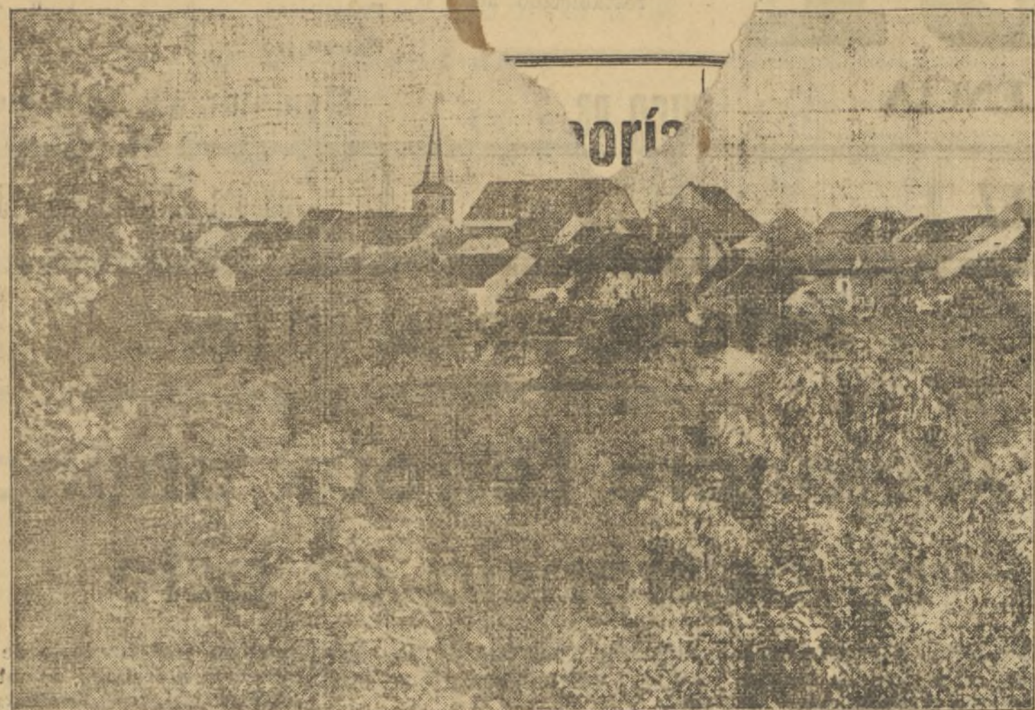
LA ALDEA DE BERUS, EN LA FRONTERA FRANCO-ALEMANA, ES UNA FORTALEZA NATURAL. LA CIUDADELA DATA DE LA EDAD MEDIA Y YA DESDE ANTES, ERA UNA PLAZA FUERTE. UNA ESPESA ARBOLEDA, CIRCUNDA LA BELLA ALDEA. HOY EN DIA, ES TÉCNICAMENTE INACCESIBLE