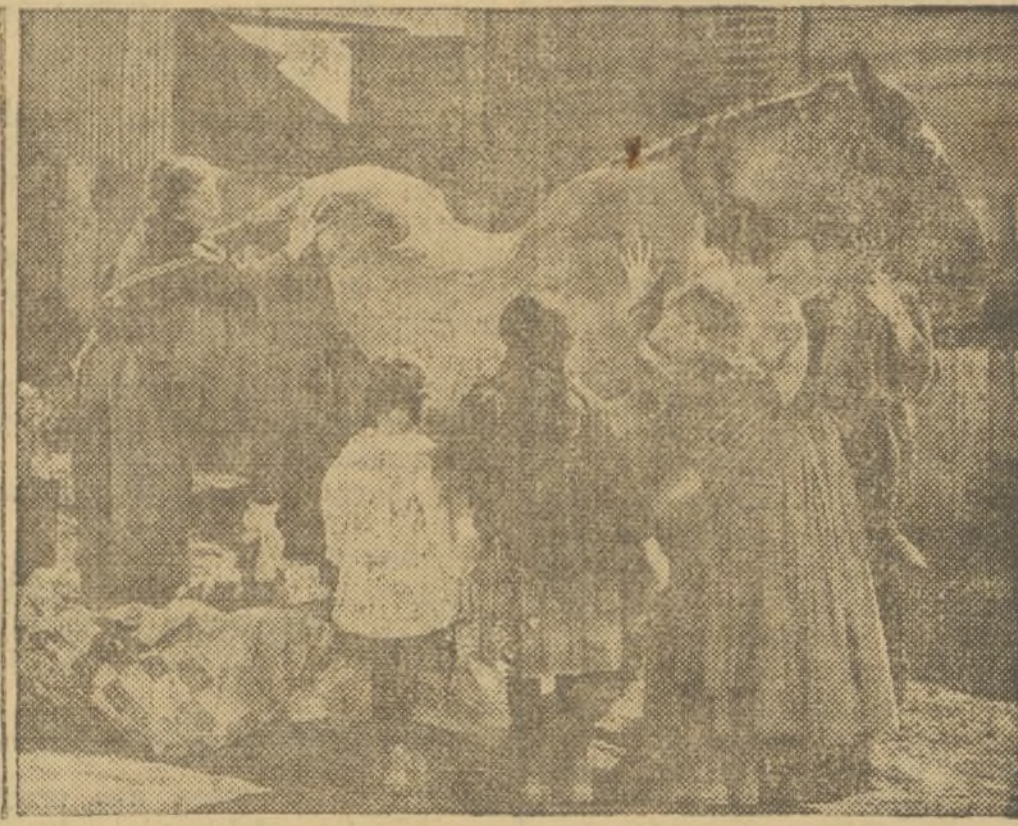
JORGE, EL CABALLO ARTISTA DEL CINE, CUYA EXPERIENCIA DE SEIS AÑOS EN LA PANTALLA, LE CALIFICÓ PARA EL FILM «LA HORTELANA», CON PAULINA LORD, KENT TAYLOR, EVELYN VENABLE, W. C. FIELDS Y ZASU PITTS

peranzado, sin saber por qué, que la suerte había de depararle un brillante y cómodo porvenir.