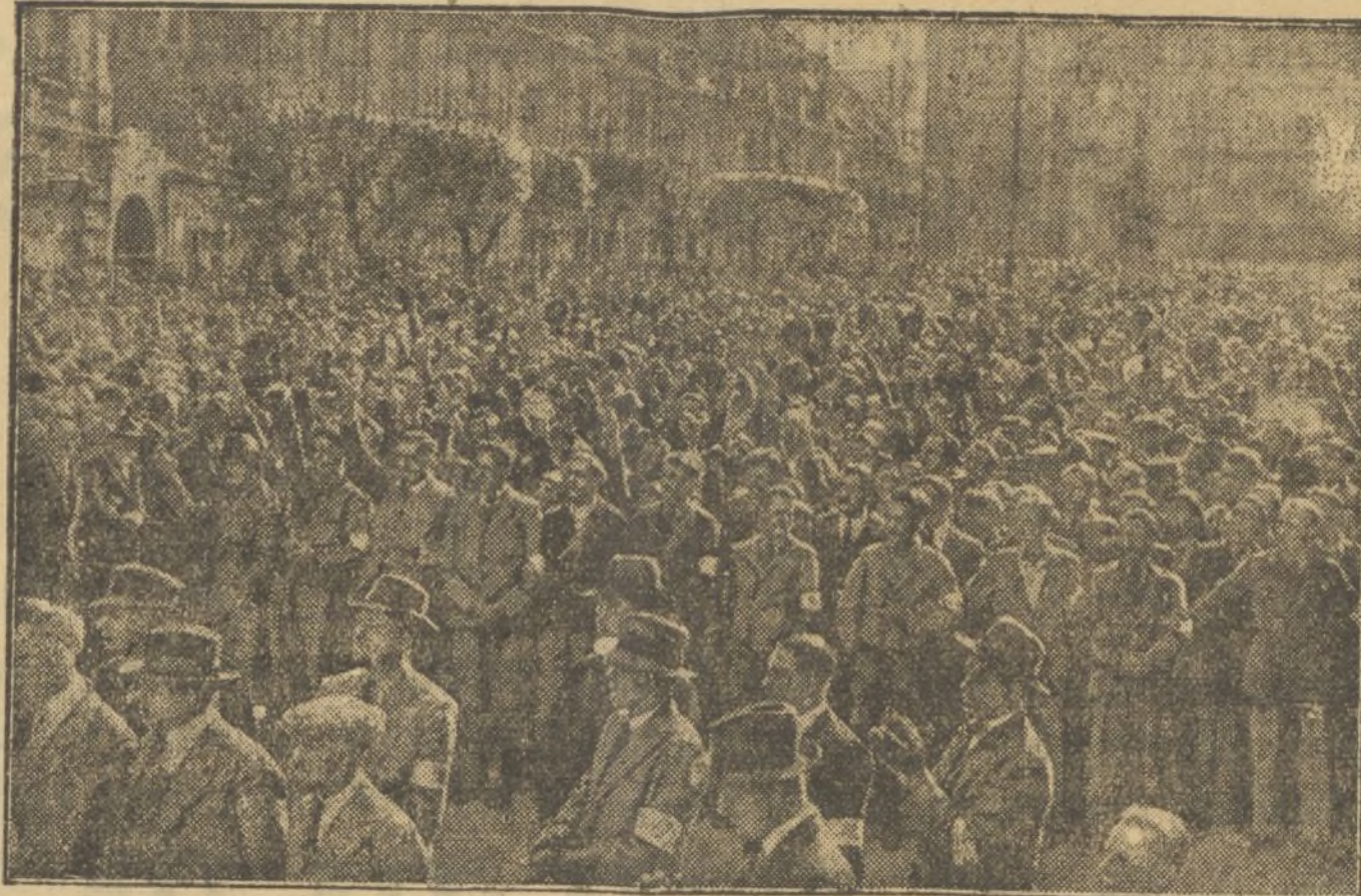
EN BRUNN SE HA CELEBRADO UN ACTO POLITICO, COMO UN PRELIMINAR DE LA PROXIMA REUNION DEL NUEVO PARLAMENTO DE CHECOSLOVAQUIA. EN ESTE ACTO HENLEIN PRONUNCIO UN BRIOSO DISCURSO