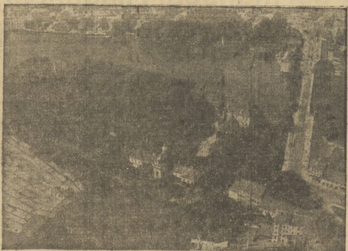
EL PALACIO DE KOEPUICK, QUE SERVIRÁ DE ALBERGUE A LOS REMEROS EXTRANJEROS DE LA OLIMPIADA, ESTA SITUADO EN UNA DE LAS MAS HERMOSAS ZONAS DE LAS AFUERAS DE BERLIN

El entierro será a las once de la mañana de hoy.