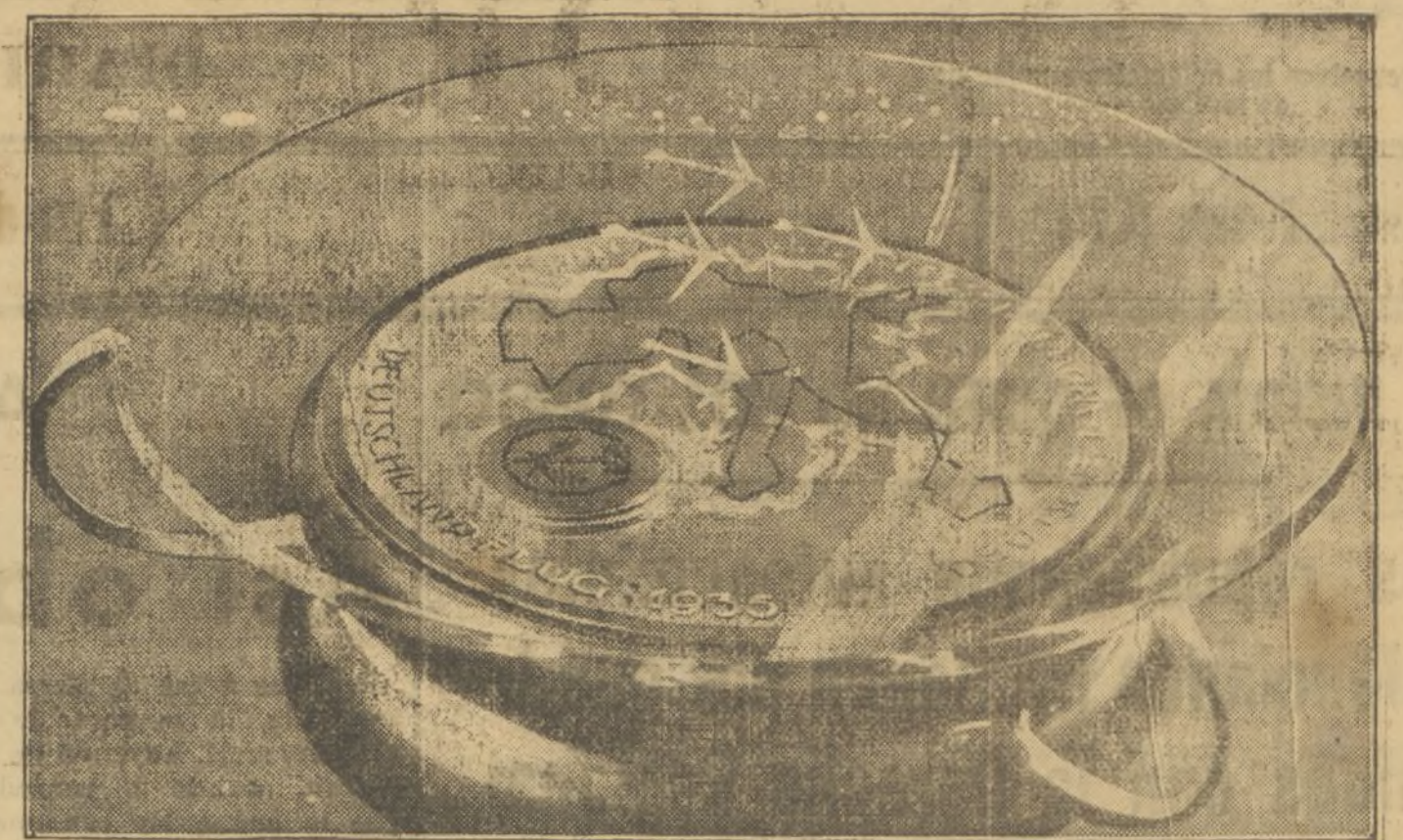
EL TROFEO-PREMIO DE LA VUELTA AEREA A ALEMANIA, QUE TERMINO DE RECIENTE, ES UNA VERDADERA OBRA DE ARTE. HA SIDO GANADO POR LA ESCUADRILLA KLEMM, DE DANZIG