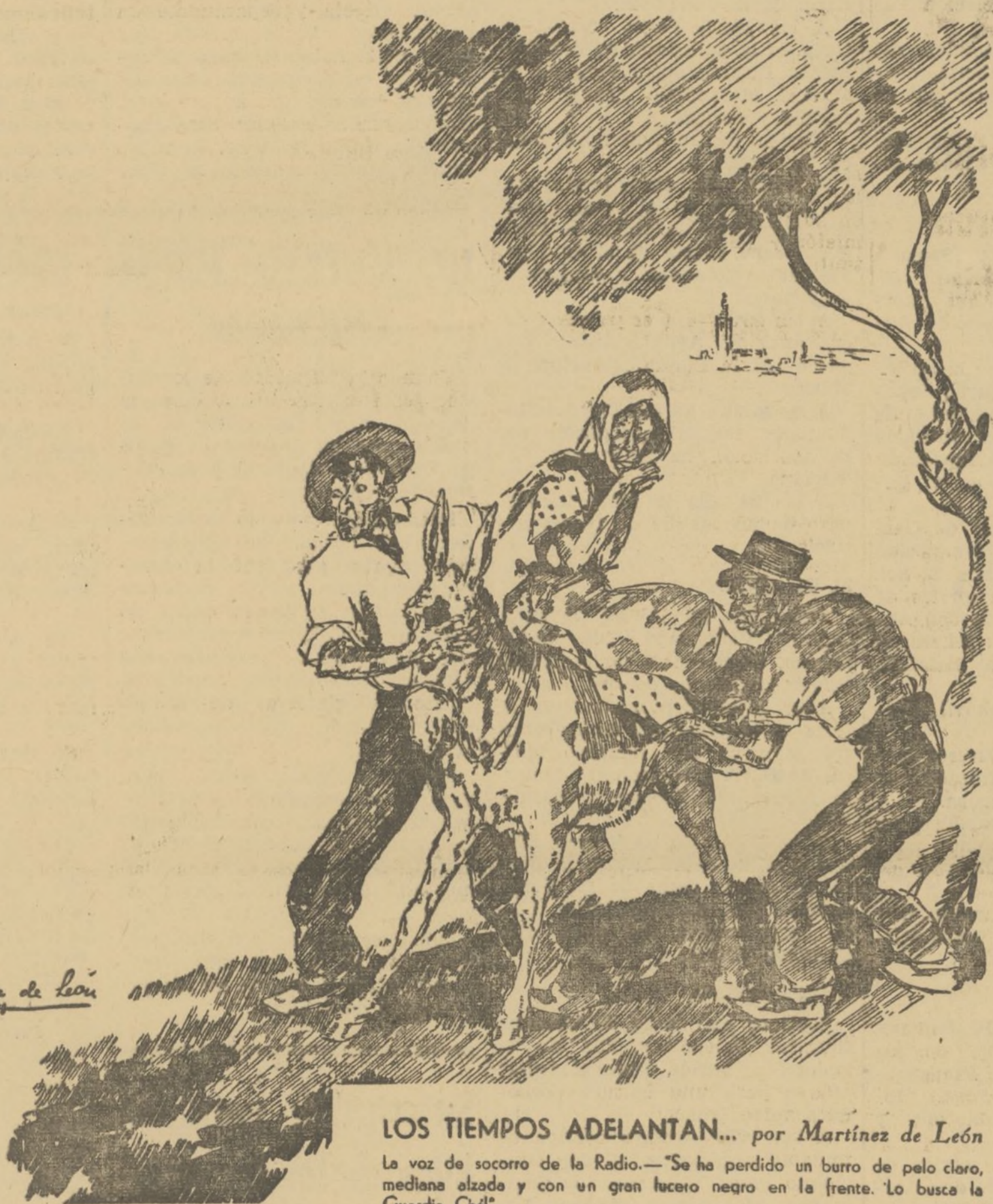
LOS TIEMPOS ADELANTAN... por Martínez de León La voz de socorro de la Radio.—Se ha perdido un burro de pelo claro, mediana alzada y con un gran lucero negro en la frente. Lo busca la Guardia Civil.

Escuche Vd. los famosos Philips "todas las ondas", "Receptodo" y "Nautilus", que reciben con extraordinaria musicalidad todas las emisoras del mundo.