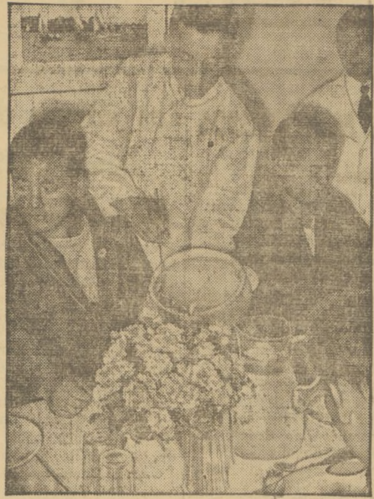
Una vista del comedor de la Aldea Olímpica en el sector japonés. El deporte es algo que abre mucho el apetito, diganlo sino estos atletas nipones

¿Que no vibran las columnas de EL PUEBLO como desean los lectores y nosotros con ellos? En la previa censura está la causa y el motivo. Al buen entendedor con pocas palabras basta