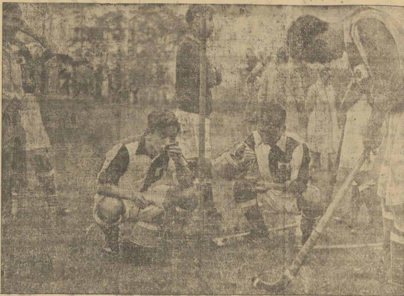
En Berlín, los atletas japoneses son los que más interés ponen en sus entrenamientos. Aquí, en un descanso de un partido de hockey, unas tazas de té y unas pastas, les permiten recuperar fuerzas.