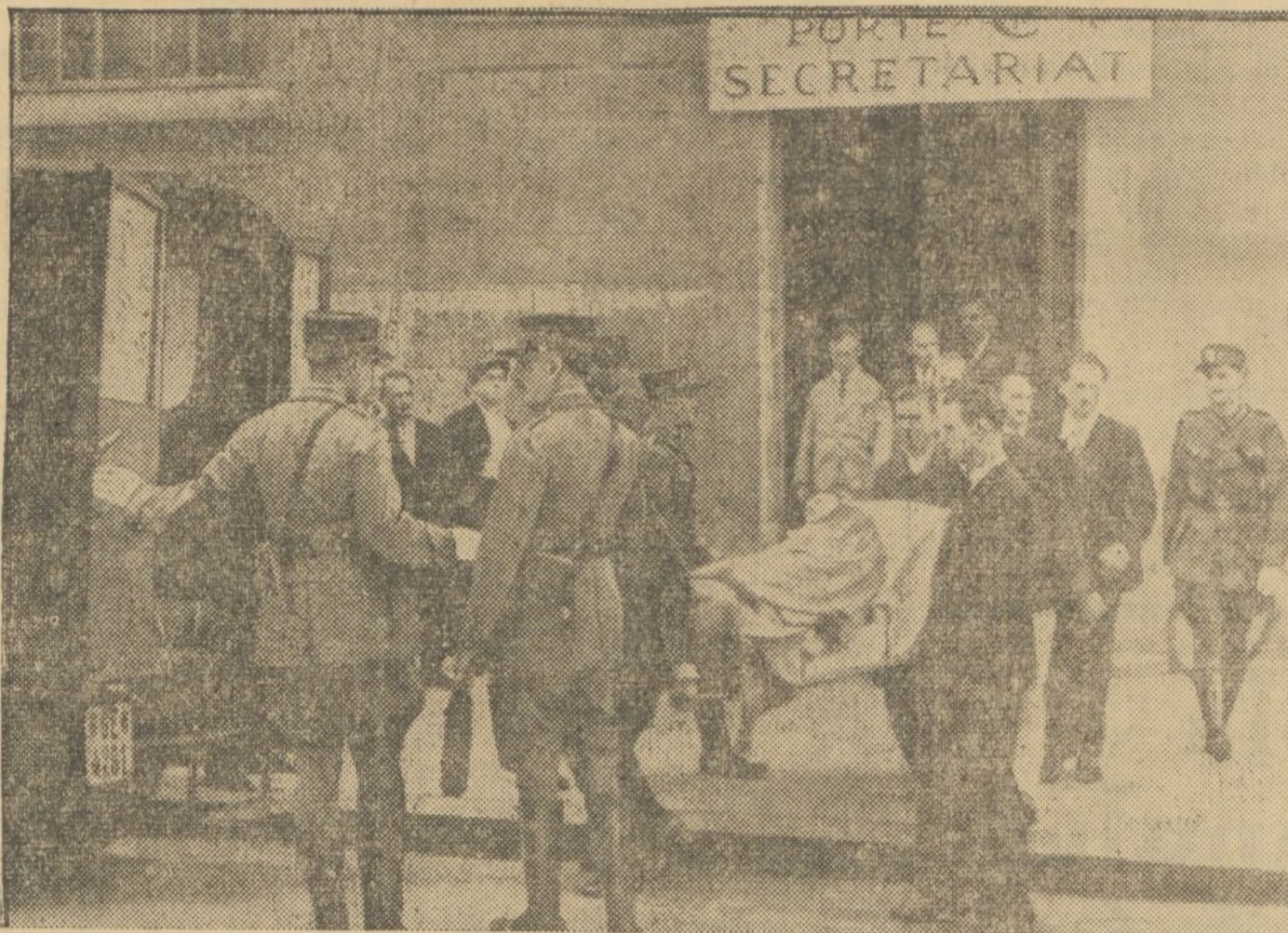
Durante una sesión de la Asamblea de la Sociedad de Naciones, el periodista checo, Stéphan Lux, se disparó un tiro. Aquí aparece en el momento de ser llevado a la ambulancia y poco después fallecido en el Hospital.