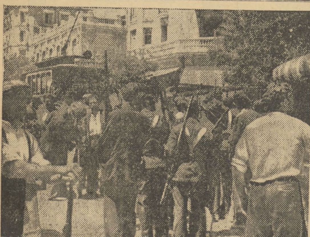
CAMPEÑINOS LLEGADOS A MADRID DESDE DIFERENTES PUNTOS DE ESPAÑA, DISPUESTOS A PARTIR PARA LOS FRENTE