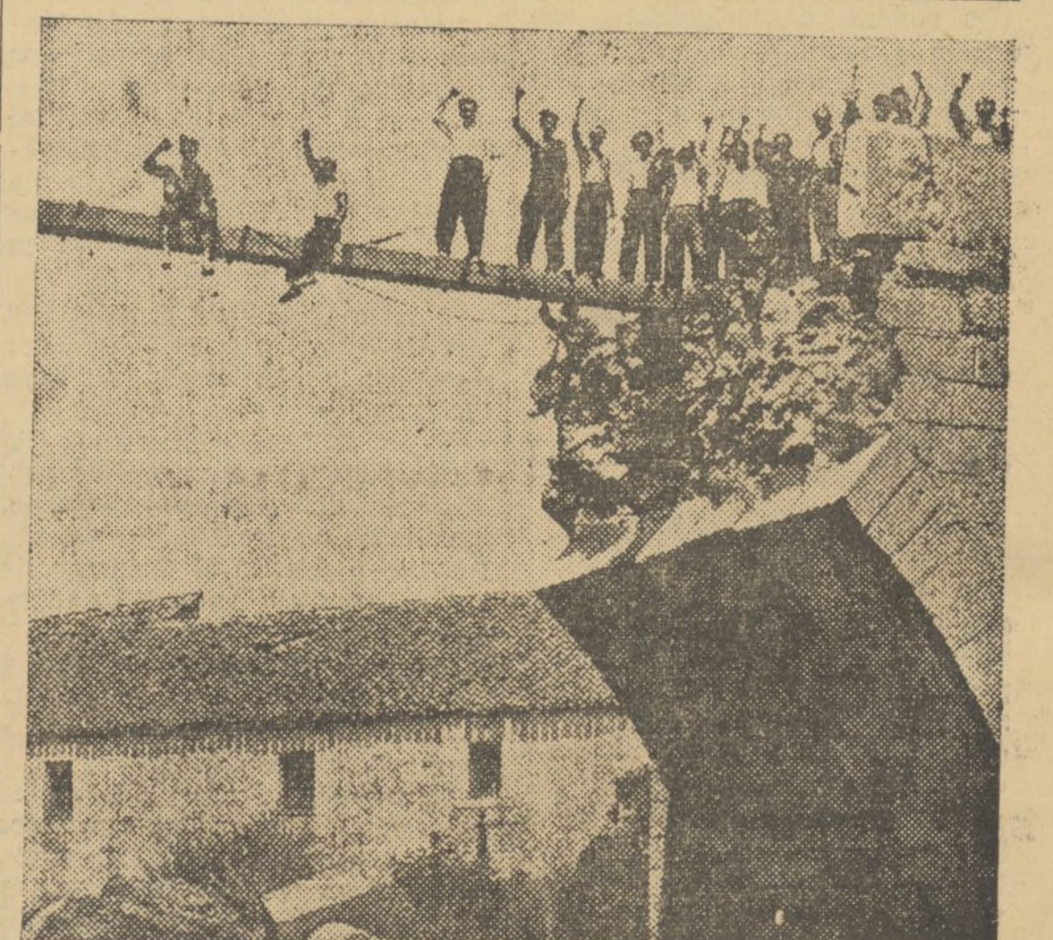
AL AVANZAR LOS LEALES EN EL FRENT DEL GUADARRAMA, LOS REBELDES VOLARON ESTE PUENTE, PARA EVITAR LA PERSECUCION