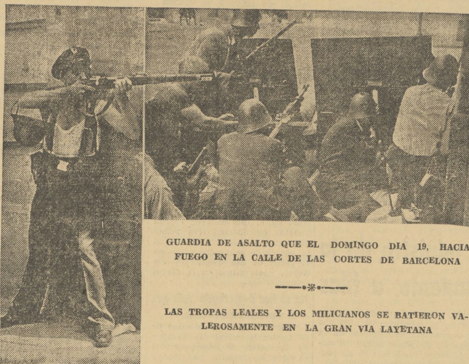
GUARDIA DE ASALTO QUE EL DOMINGO DIA 19, HACIA FUEGO EN LA CALLE DE LAS CORTES DE BARCELONA

Los Aceros, heroicos atletas de la guerra, se alineaban en el patio, abrazando orgullosos, como si fuera una novia, su fusil liberador, que muy pronto ha de darles la paz soñada.