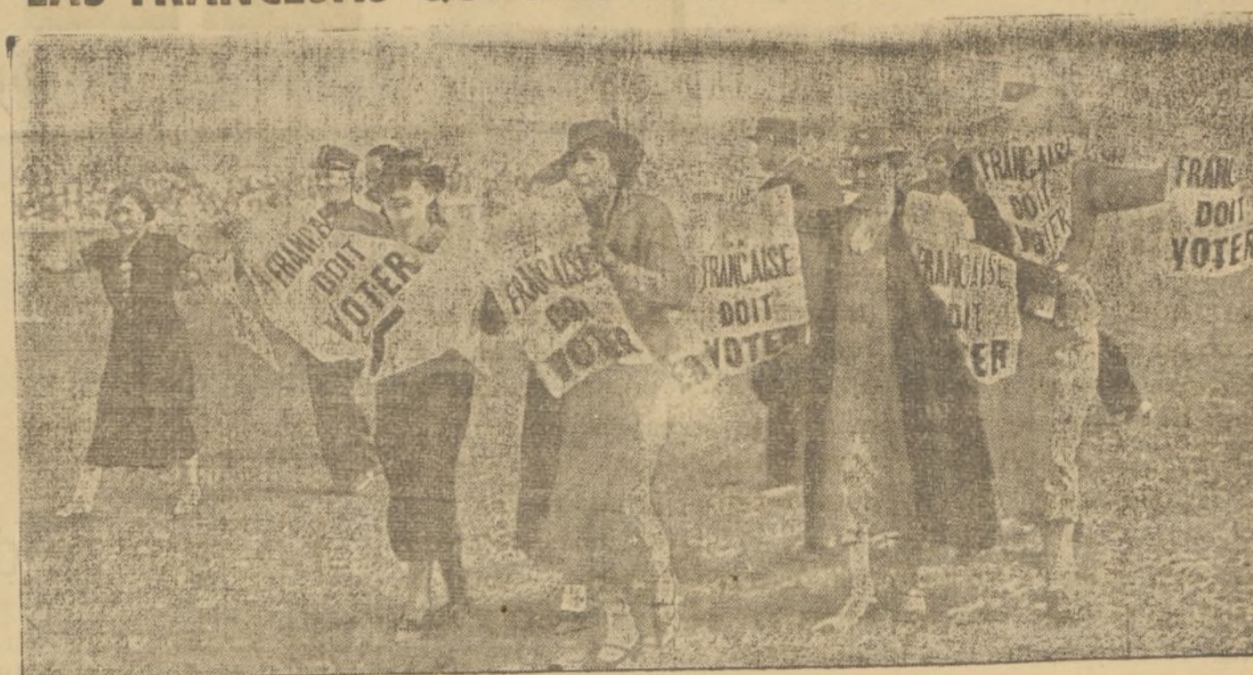
Cada oportunidad es aprovechada por la mujer francesa para pedir el voto. En el Gran Premio Hípico de Longchamps, mujeres portadoras de carteles reclamaron una vez más este derecho.