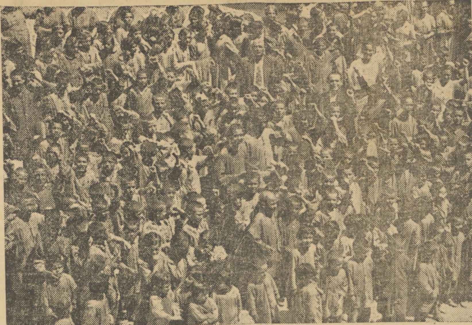
LOS NIÑOS DE LA CASA MISERICORDIA AL TOMAR POSESION EL PERSONAL QUE HA SUSTITUIDO AL RELIGIOSO EN DICHO ESTABLECIMIENTO BENEFICO

Es de creer, que dado el rasgo completamente desinteresado de los empleados de la empresa y de los propietarios de galgos, al organizar este beneficio, el pueblo valenciano responderá como ellos y asistirá en gran número, a fin de engrasar crecientemente los ingresos de la Junta Provincial de Socorro.