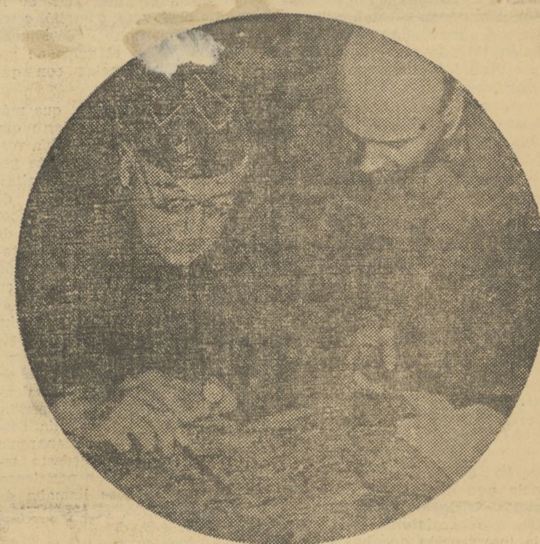
El ilustre general Miaja, cuyas altas dotes militares son efica- císima garantía para nuestra acción en el frente andaluz, don- de las columnas avanzan incesantemente, dejando el campo lim- pio de enemigos, estudia sobre el mapa los próximos movimien- tos de ataque

Para la evacuación de los heri- dos desde la estación de Cercadilla, se emplean los automóviles, que rápidamente llegan a Madrid.