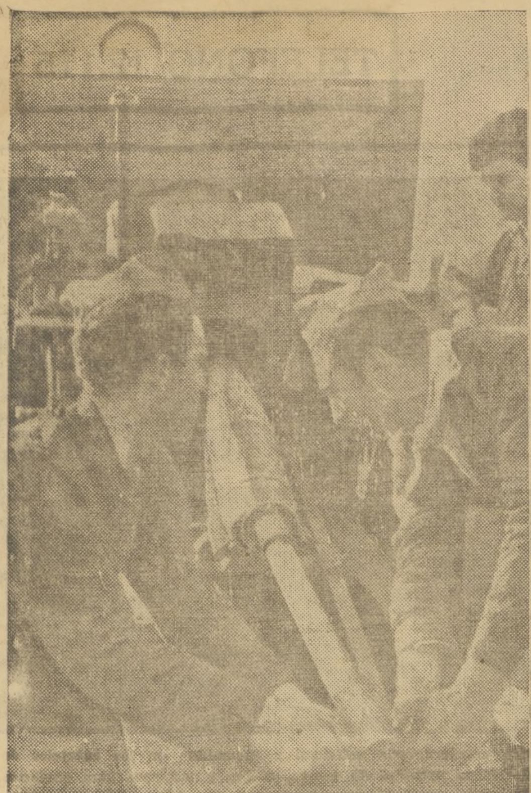
CARGA DE UNA PIEZA DE 15' DURANTE EL BOMBARDEO CON QUE SE PROTEGE EL AVANCE DE UNA COLUMNA LEAL