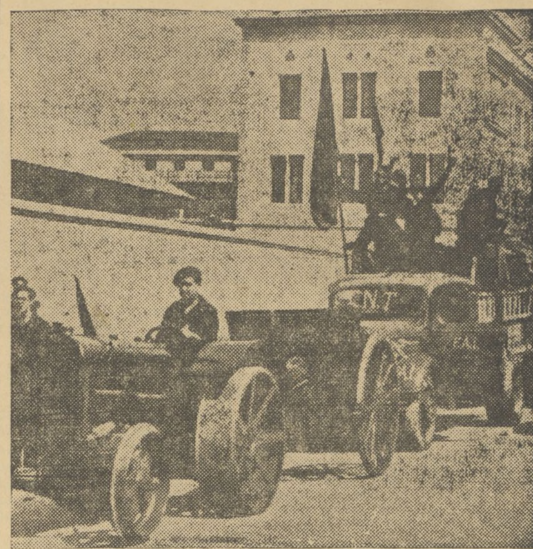
Con extraordinaria actividad se acumulan en los cuarteles de Barcelona material de guerra, coches y camiones para enviarlos al frente, aumentándose diariamente los elementos para facilitar el avance de las columnas y reforzar su ofensiva. He aquí los preparativos de una expedición