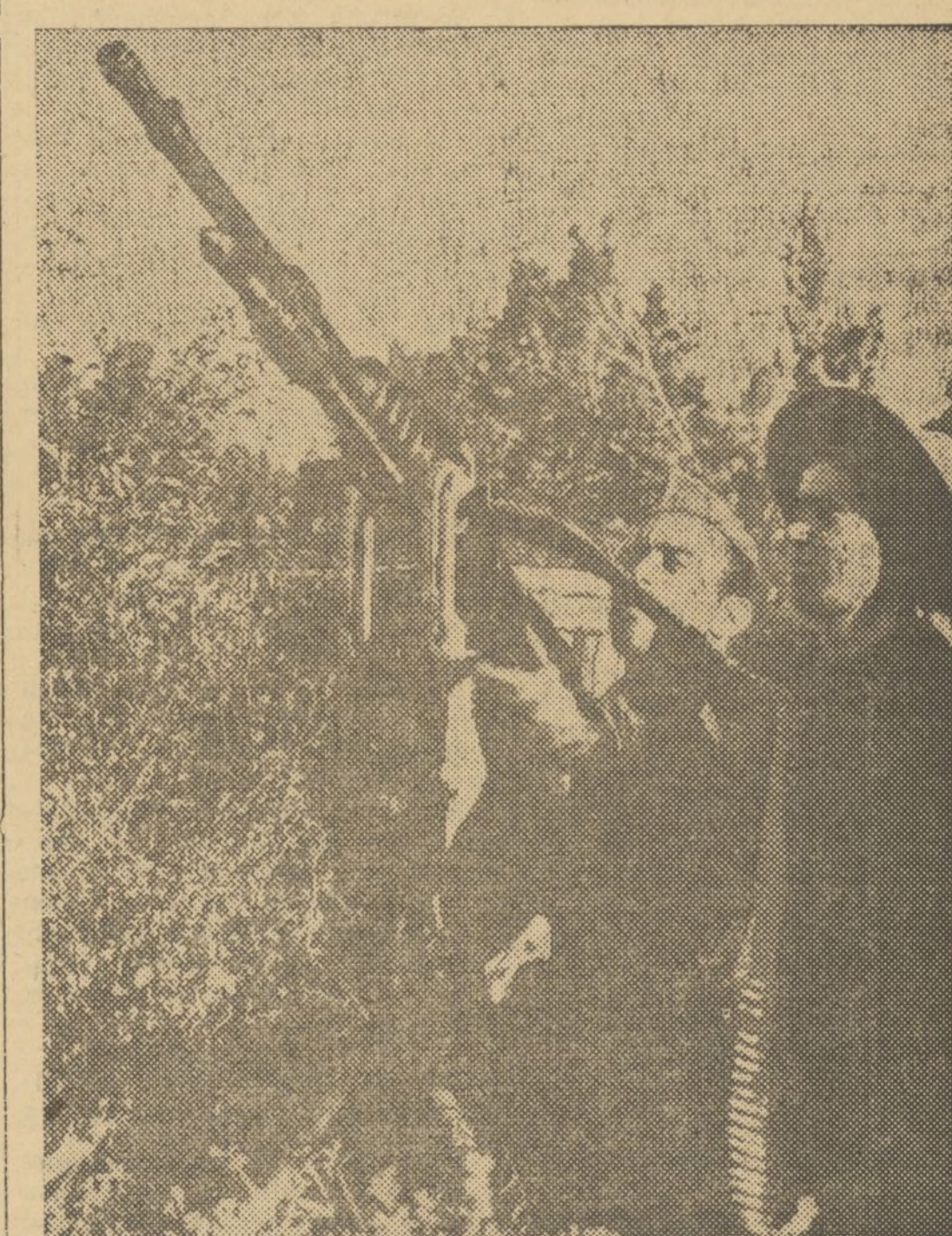
DISPARANDO UNA AMETRALLADORA OCULTA ENTRE EL RAMAJE, EN PLENA SIERRA DEL GUADARRAMA