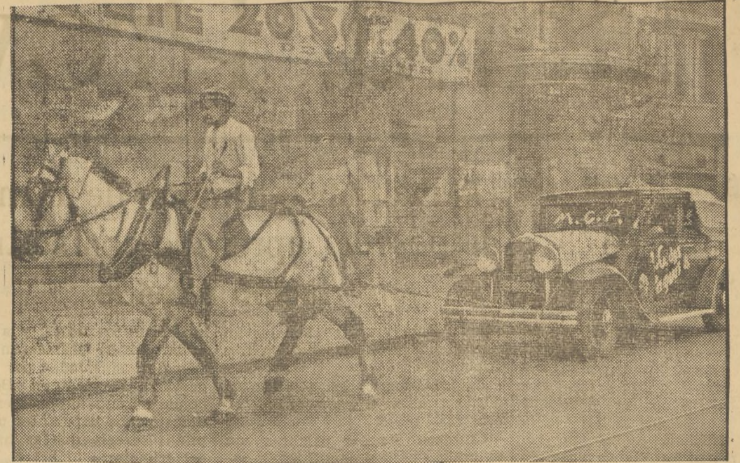
En Austria, el Gobierno Federal ha creado nuevos impuestos para los vehículos a motor. Muchos de ellos han dado de baja a sus autos y los pasean de esta forma pintoresca, arrastrados por un caballo

Explosivos, La Maquinista Terrestre y Marítima, S. A.; La Hispano Suiza, S. A.; Material para Ferrocarriles y Construcciones, S. A.; Productos Pirelli, S. A.; Riviere, S. A.; Metales y Platería Ribera, S. A.; Francisco Lacambra; G. de Andreis Metalgraf Española.