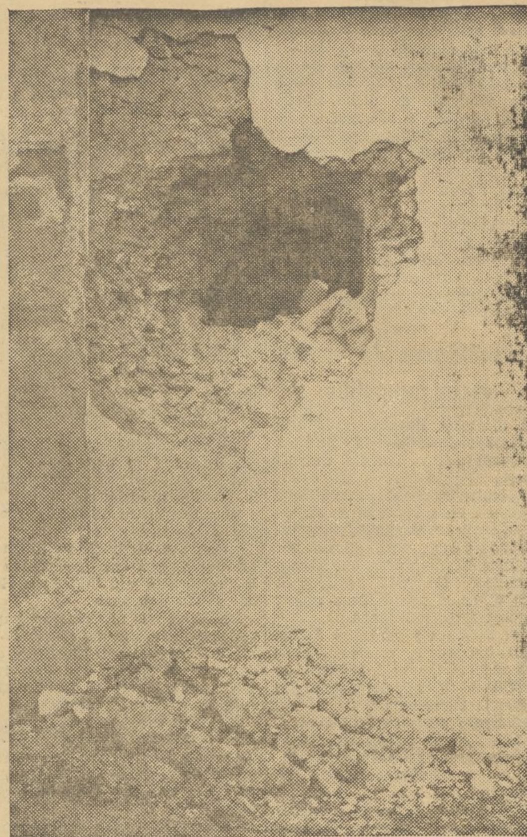
EFECTOS DE UN PROYECTIL EN EL CASTILLO

Y a esperar al día siguiente, para ver qué sorpresas nos reserva. Se destaca en los hechos del día, el más saliente de todos: la