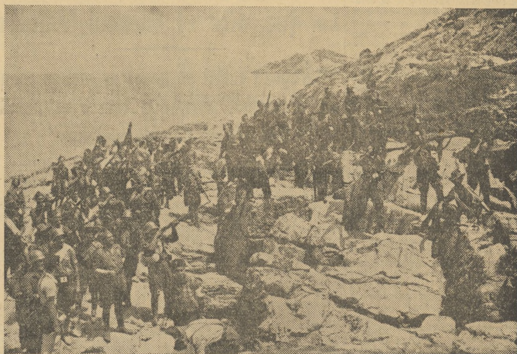
DESEMBARCO DE LAS MILICIAS VALENCIANAS EN SAN ROQUE

Hemos presenciado otro bombardeo. El jefe de la expedición,