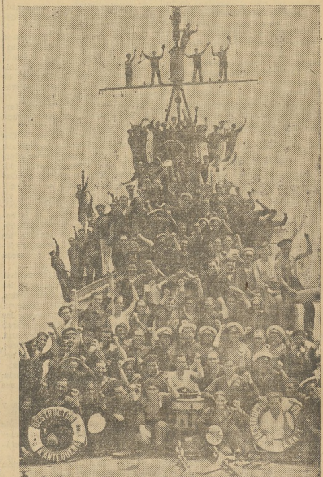
DOTACION DEL DESTRUCTOR «ALMIRANTE ANTEQUERA»

rra», senos dijo. Y hemos sabido cumplir y hemos sido resignados. Lo mismo dormimos sobre cubierta, junto a las máquinas, que sobre una camilla sanitaria, que sobre el muelle colchón del camarote lujoso que fué de los altos mandos. Hemos sabido perder una comida y pasar sed y comer ran-