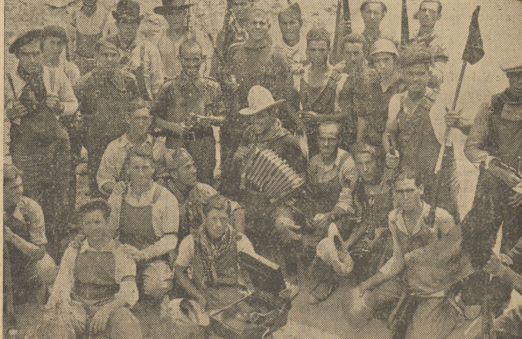
LOS VALEROSOS LIBERTARIOS DE ALCIRA, RIEN PENSANDO EN SU PROXIMA VICTORIA