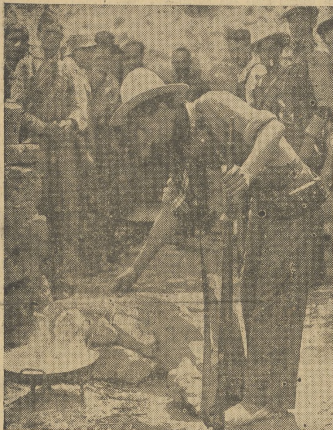
LA PAELLA, VA CON LOS VOLUNTARIOS A TIERRAS DE ARAGON

La paz y el trabajo son la retaguardia de los voluntarios de la columna de Hierro.--El heroico grupo de Los Suicidas.--Música de baile y cante flamenco, en los momentos de descanso.--Optimismo y gana de pelea en todo instante. Una buena "operación gastronómica"