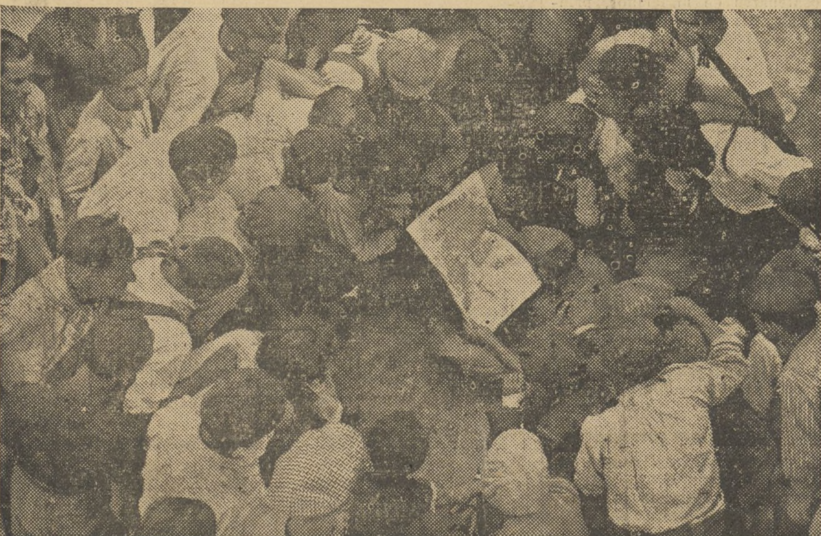
«EL PUEBLO», SE LEE CON FRUICION POR LOS DESTACADOS EN SARRION