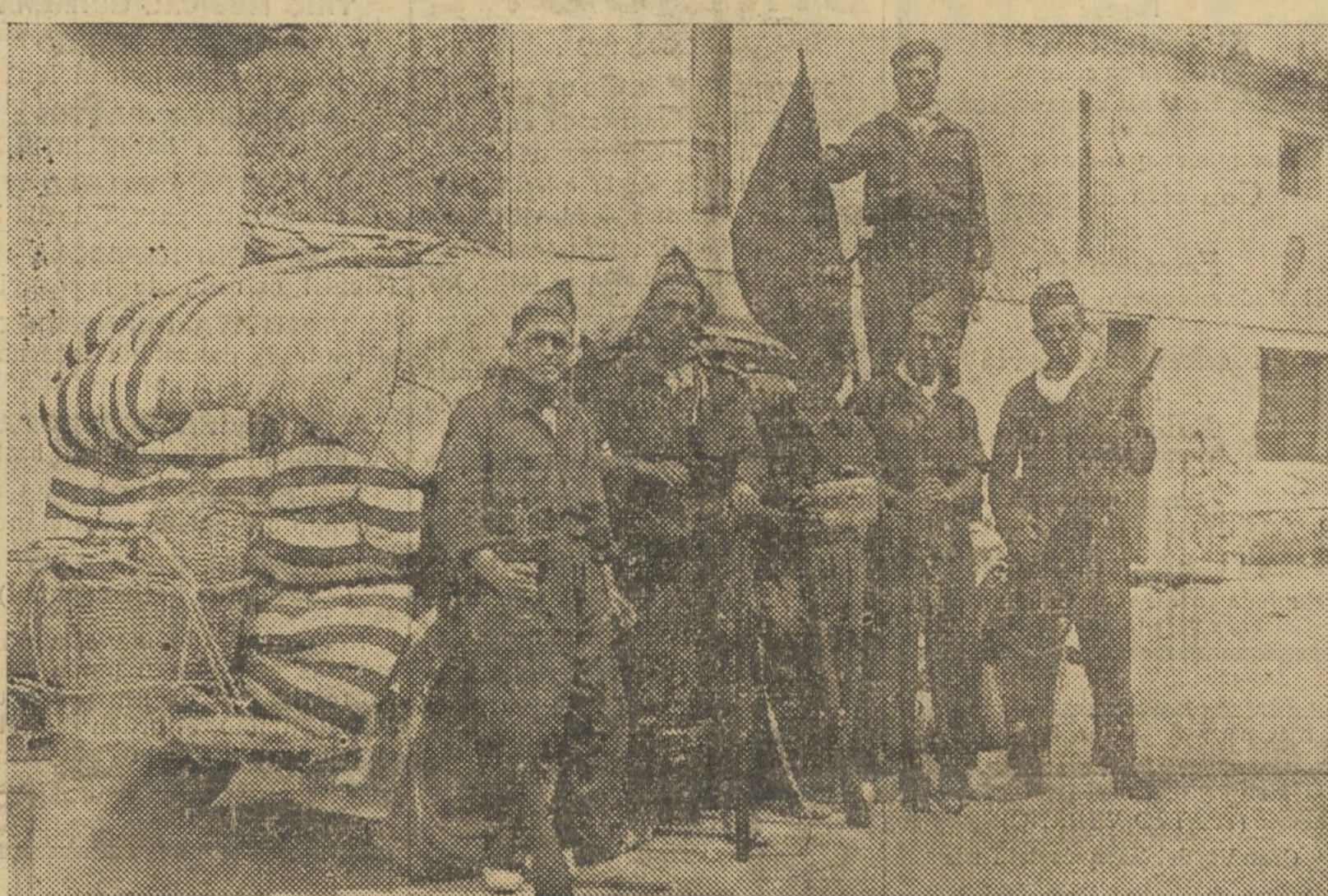
EL GRUPO DE «LOS SUICIDAS», HEROICOS Y ESFORZADOS LUCHADORES

—¿Para esto vine al frente? Yo quiero ir a la línea de fuego y entrar en Teruel. Tal vez ha-