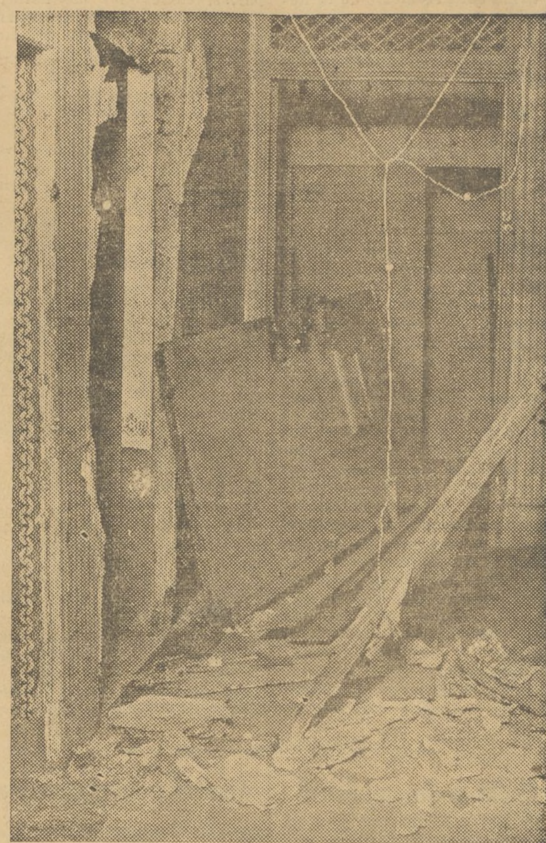
LA POLICIA TUVO QUE DERRUMBAR LA PUERTA DE LA ESCALERA PARA PODER ENTRAR Y HALLAR LAS BOMBAS Y MUNICIONES QUE ESCONDIAN LOS FALANGISTAS