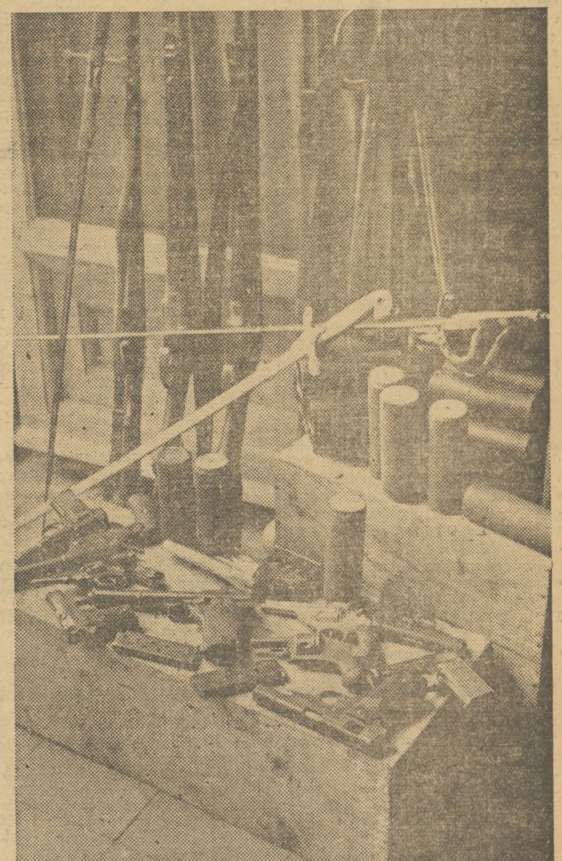
BOMBAS, ARMAMENTOS Y MUNICIONES HALLADOS POR LA POLICIA, EN LA CASA DE LA CALLE DE SALINAS, NUM. 3, HABITADA POR ELEMENTOS FALANGISTAS

Una vez en el interior no hallaron más muebles en las habitaciones que los propios de un despacho, pero inspeccionando detenidamente encontraron en una de las habitaciones que tiene un balcón recayente a un corralillo un sótano perfectamente habitado de la planta baja, la entrada de la planta baja, la entrada de bar-