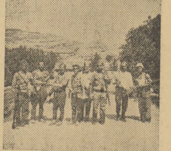
A LA ENTRADA DE VILLEL, EN LA CARRETERA DE TERUEL, CORTINA RECIBE UN MENSAJE QUE ACABA DE TRÁR NUESTRA AVIACIÓN. AL FONDO, LA POBLACION Y EL CASTILLO

Villel, a las doce horas del 22 de Agosto de 1936.