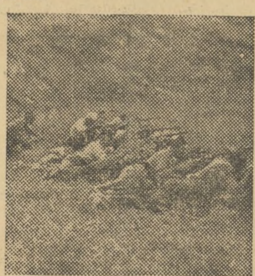
UNA DE NUESTRAS AVANZADILLAS EN LAS PROXIMIDADES DE VILLEL

Desde Libros se organizó la columna que debía tomar Villel, considerada como el objetivo más estimable para la conquista de Teruel.