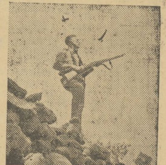
UN MILICIANO, DE PIE, SOBRE UNA DE LAS FORTIFICACIONES FASCISTAS DE VILLEL

Nos dicen al entrar en Villel, que los fascistas al retirarse, sacaron de la cama al maestro na-