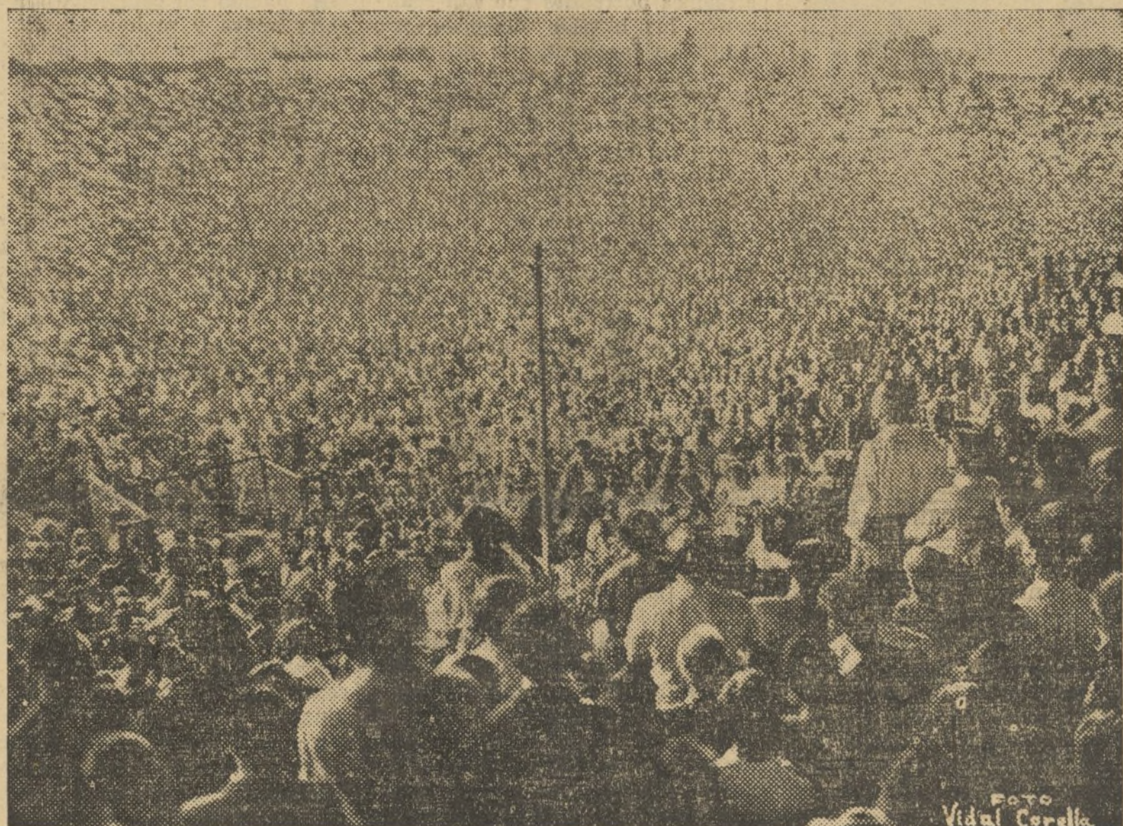
UN ASPECTO DEL CAMPO DE MESTALLA, DURANTE EL MITIN DEL DOMINGO