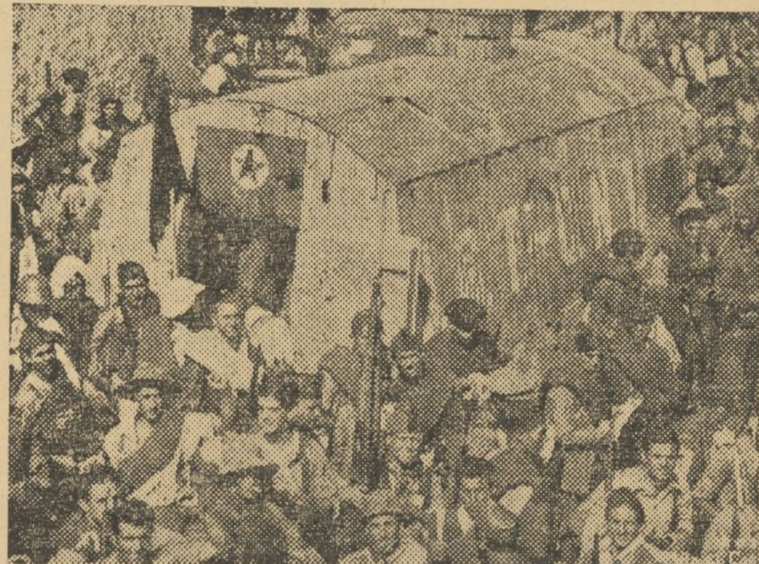
LLEGADA AL FRENTE DE TERUEL, DE MILICIAS Y CARROS DE ASALTO

están preparando los bártulos para trasladar sus posiciones al reducto inmediato, conquistado para la causa de la libertad.