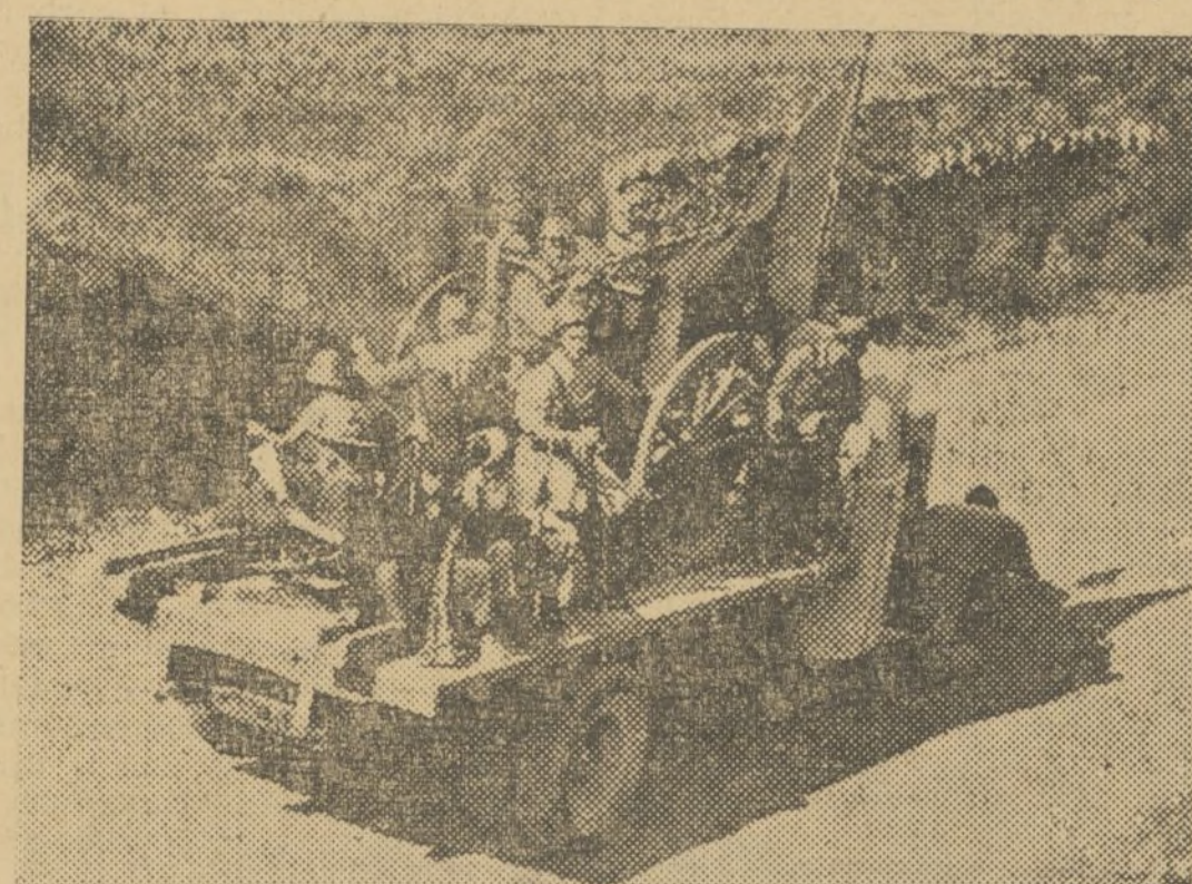
TRANSPORTANDO CARONES AL FRENTE DE TERUEL

El optimismo cunde por las filas. Se lucha con fe y entusiasmo. El triunfo no les puede regatear la merced de su asistencia. Teruel está virtualmente tomado.