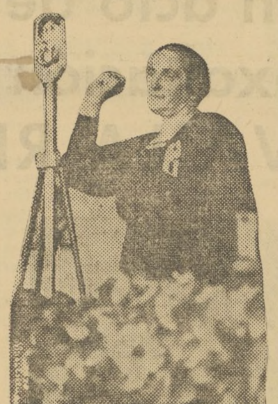
DOLORES IBARRURI «LA PASIONARIA», COMUNISTA

No os extrañe si en estos momentos de intensa emoción, cuando veo congregada una multitud que, llena de entusiasmo, siente