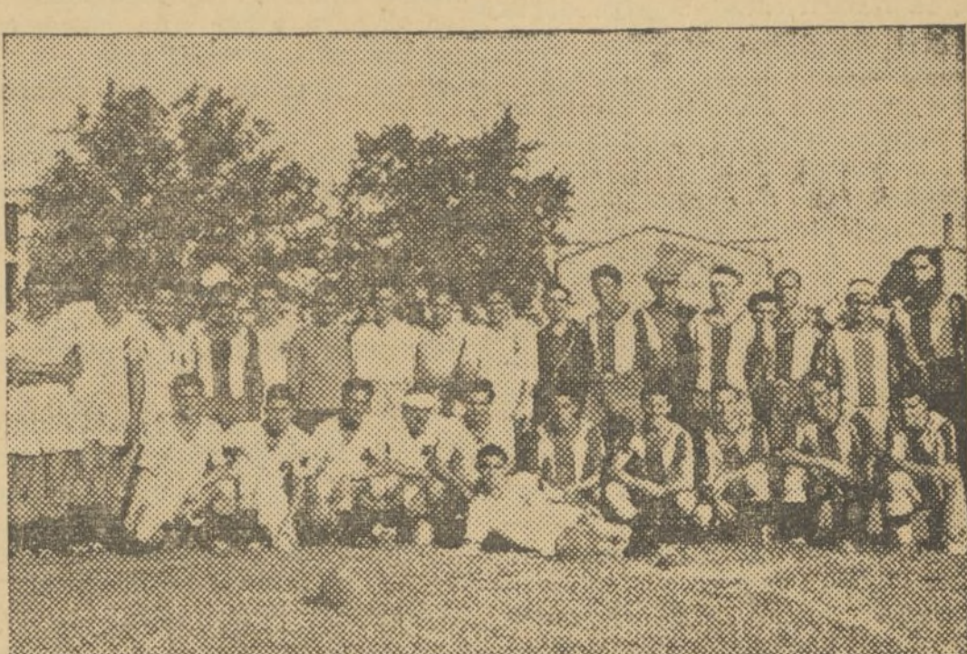
LOS EQUIPOS DEL VALENCIA Y LEVANTE QUE HAN JUGADO UN PARTIDO A BENEFICIO DE LOS MILICIANOS QUE LUCHAN EN EL FRENTE

En el partido a beneficio de las milicias, venció el Levante al Valencia, por tres goals a dos. --- Guillén, el mejor