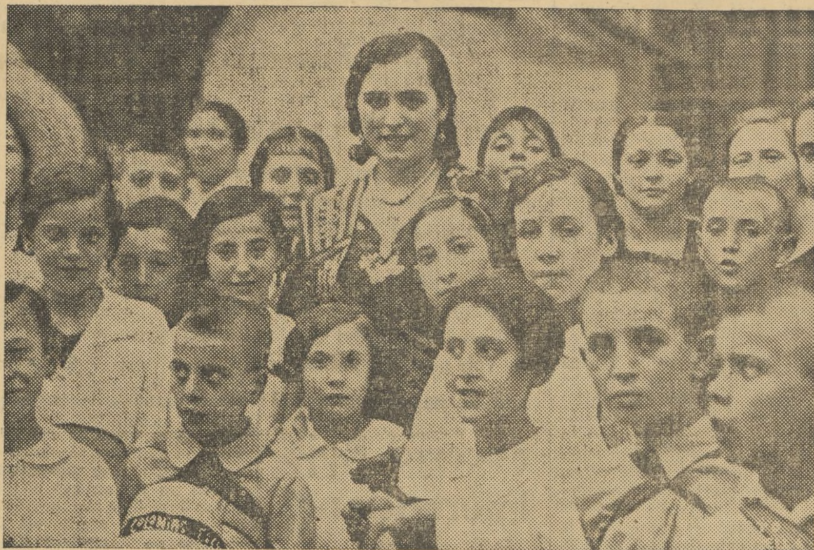
La fallera mayor rodeada de un grupo de niños, hijos de milicianos, que han salido con las colonias escolar para Godella

Los leales continuaron su avance hasta conquistar Belchite, de donde huyeron los facciosos.