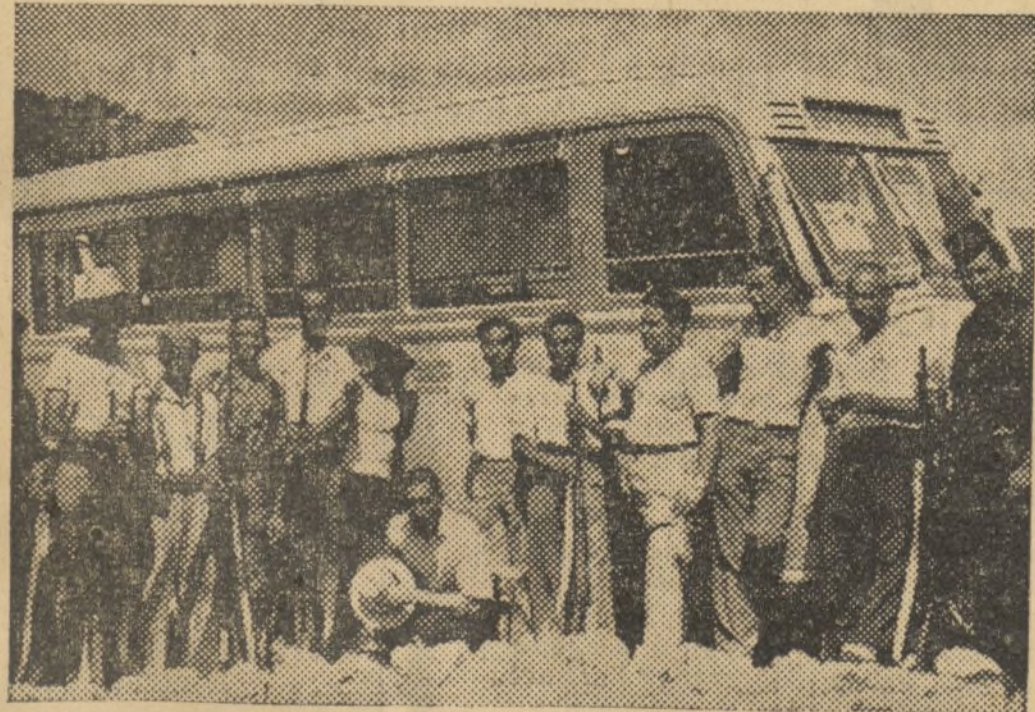
El autobús de la línea urbana de Valencia, convertido en imprenta, junto con los impresores que editan un diario y que se reparte entre los milicianos que luchan en el frente de Teruel