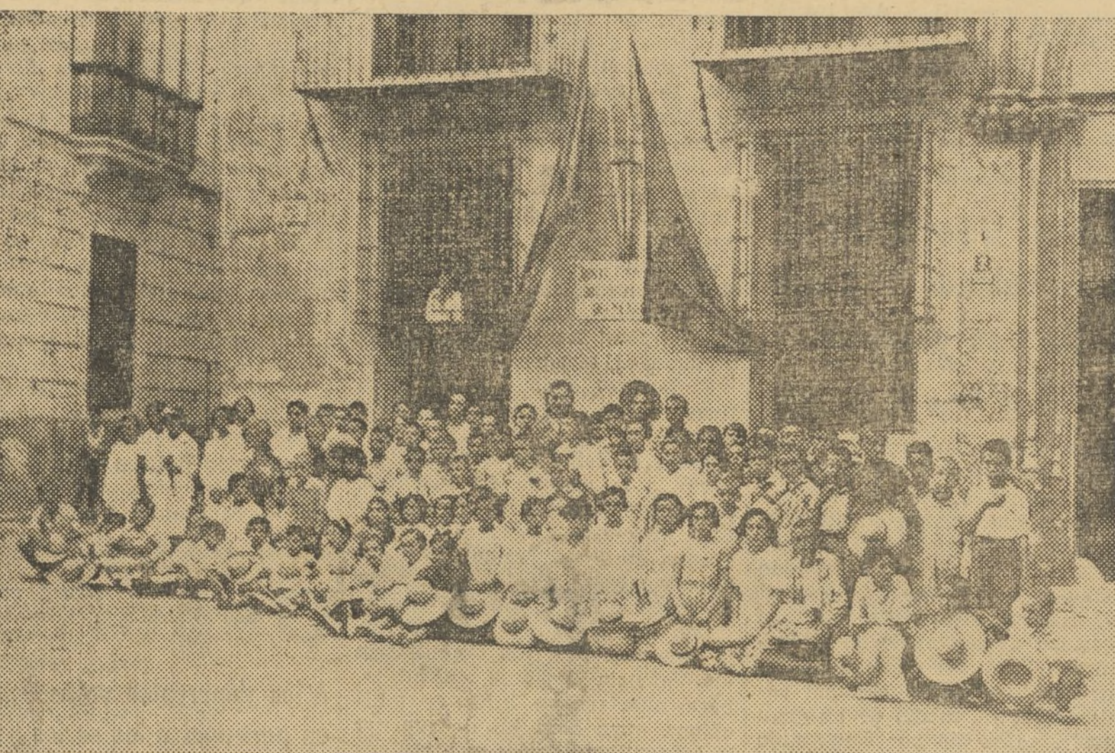
En estos momentos de lucha en el frente, bueno es ocuparnos de los niños en la ciudad. Este grupo, en número de ciento veinte, forman las colonias escolares Gómez Ferrer, Giner de los Ríos y Doperto, que han salido para Godella