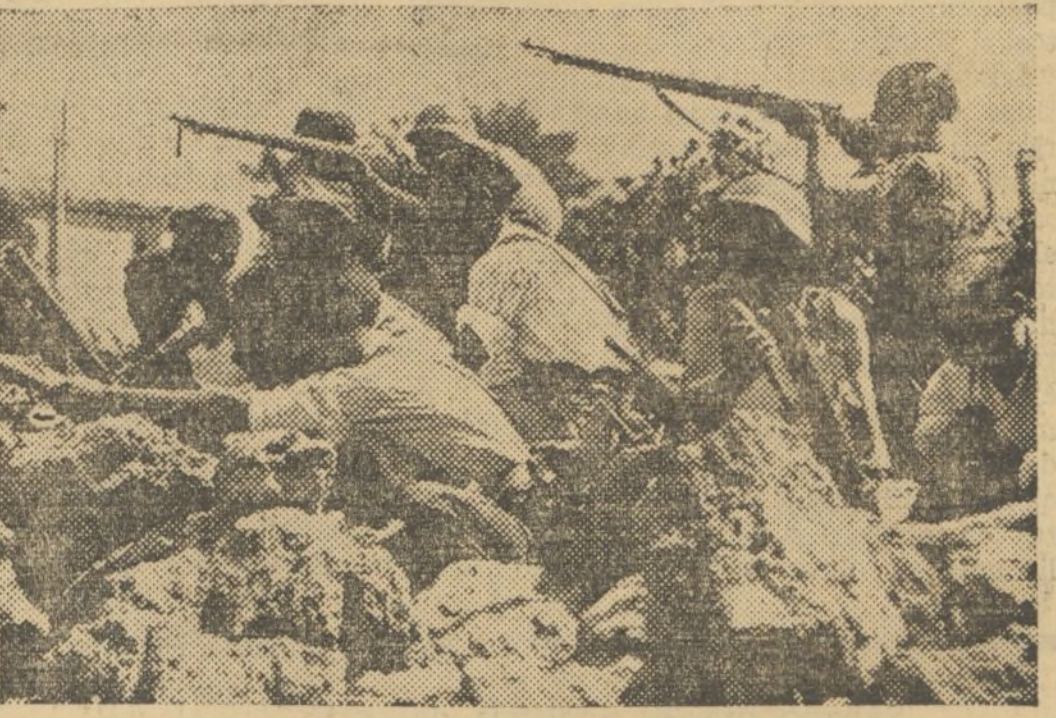
Grupo de morteros de la columna Uribe-Peire, parapetados en las montañas durante el avance sobre Teruel

Después de dos días de descanso en Madrid, ha marchado de nuevo al frente el batallón Largo Caballero, siendo odespedido entusiásticamente.