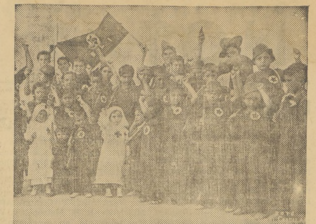
GRUPO DE NIÑOS DE BENIMACLET, QUE HAN FORMADO UNA MILICIA PARA RECAUDAR FONDOS CON DESTINO A LOS QUE LUCHAN EN EL FRENTE