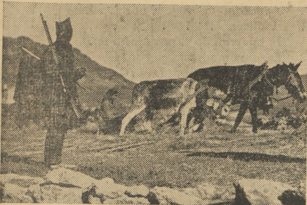
Los milicianos de la columna Uribe-Peire, después de libertar a los pueblos a su paso hacia la toma de Teruel, cuidan de los trabajos agrícolas.

evitemos la posibilidad de sacrificar víctimas inocentes. Bastantes inocentes caerán en las líneas de fuego y en las poblaciones ocupadas por los fascistas! Las armas la pelea, allá; aquí, mano al trabajo. La administración de justicia para los encargados de ella, llámense tribunales especiales o Comité de Salud Pública.