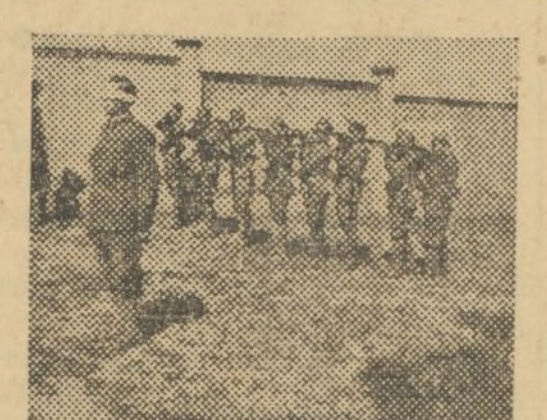
Foto hallada en el registro de la casa de un fascista, en Villel, que lleva la siguiente inscripción: «Así castiga el fascismo a los traidores. Dad a conocer esta fotografía entre los nuestros»

—Compañeros: Por ser el primer caso de pillaje que se da en nuestras milicias, queremos que sea conocido de vosotros y también