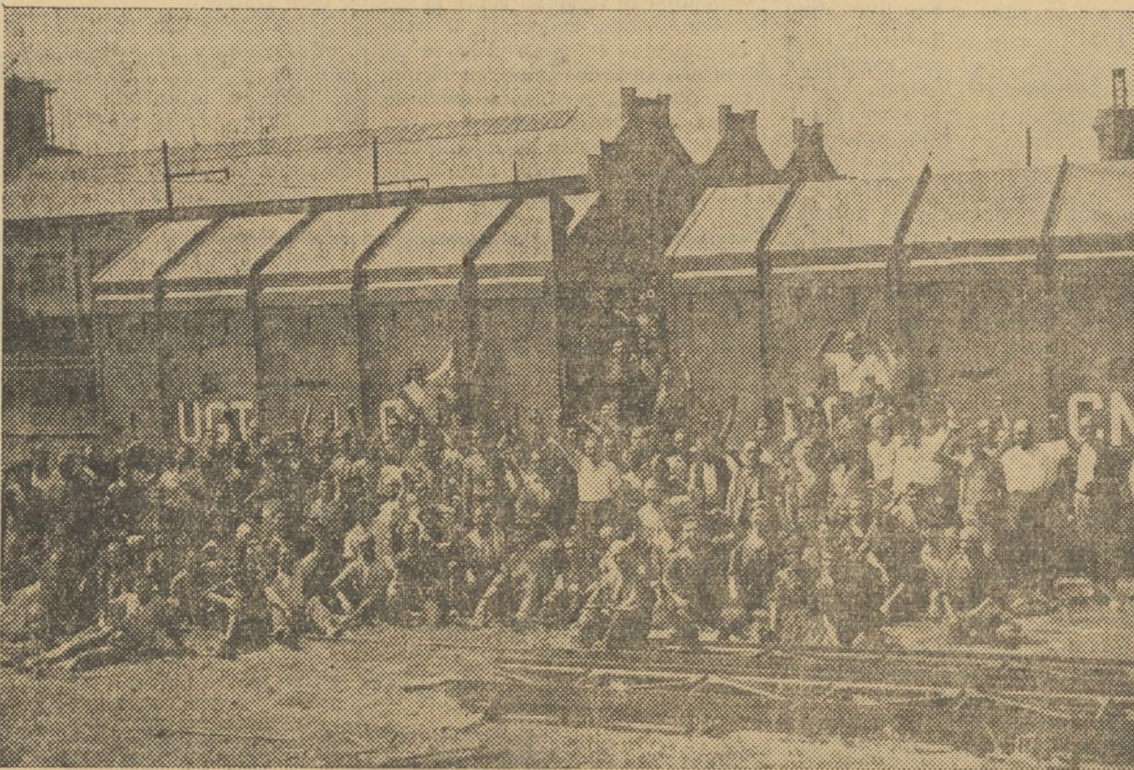
LOS OBREROS DE LOS TALLERES DEVIS JUNTO CON LOS DOS VAGONES BLINDADOS QUE HAN CONSTRUIDO PARA EL FRENTE DE ARAGON