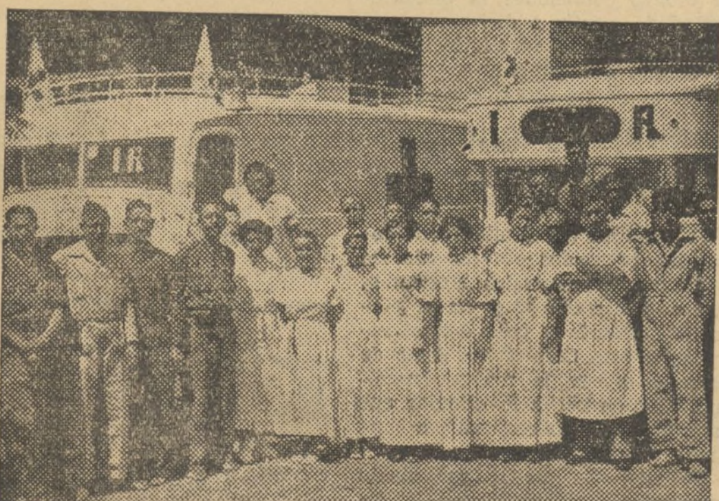
AMBULANCIAS DEL HOSPITAL DE SANGRE DE IZQUIERDA REPUBLICANA, DISPUESTAS PARA SALIR AL FRENTE DE ARAGON, EL PERSONAL SANITARIO Y AUXILIAR

Sociedad de Obreros Molineros Arroceros. — Esta sociedad celebrará junta general ordinaria el domingo, a las nueve de la mañana, por primera convocatoria y a las diez por segunda, en nuestro domicilio social, Calatrava, 2, para tratar de asuntos de mucho interés para la sociedad.