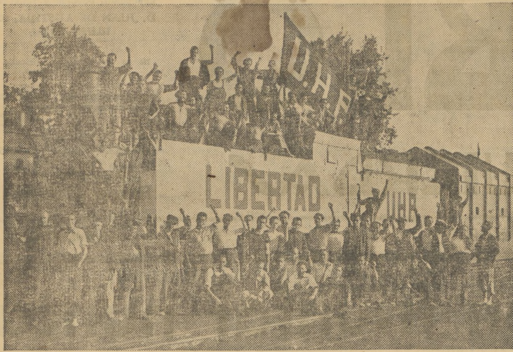
LOS OBREROS DE LA CENTRAL DE ARAGON QUE HAN BLINDADO LA LOCOMOTORA QUE FORMABA EL TREN CON DESTINO AL FRENTE ARAGONES