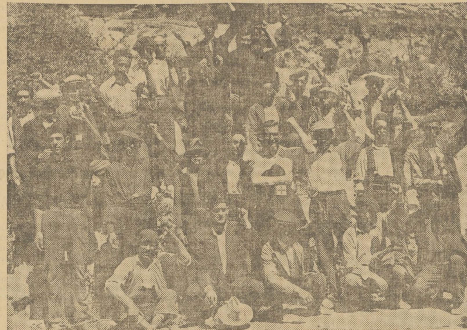
Vecinos de Teruel, que huyen de su tierra, se refugian en las avanzadas de la columna Uribe-Peire

una pensión. En cambio, en su casa, se alojaron dos frailes.