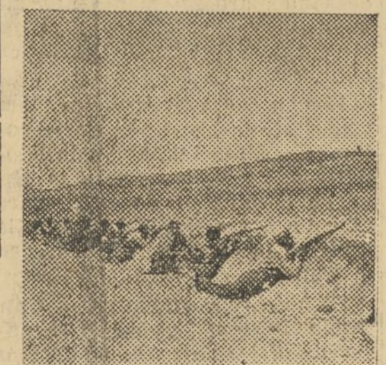
Una de nuestras avanzadillas, junto a la carretera de Teruel, en Llanos de Campillo

Debido a la inteligente actividad del teniente coronel Peire y la diligente colaboración del gobernador civil de Cuenca, formóse una pequeña columna de guardias nacionales y milicianos de la parte de Cuenca, reforzada por milicias de Valencia y asumiendo