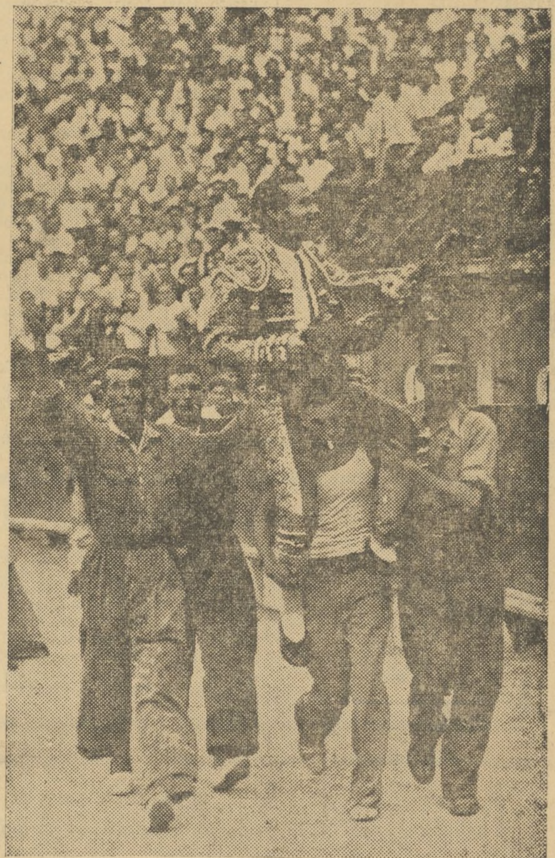
DOMINGO ORTEGA, ESE PALETO Y ESE GRAN TORERO, A HOMBROS DE UN GRUPO DE ENTUSIASTAS

El resto de los heridos también ha mejorado mucho.