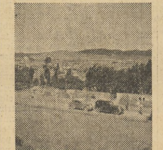
Una vista de Bezas, después de llegar nuestros primeros coches de la plana mayor

Desde donde tiene lugar el encuentro a Campillo hay escasamente tres kilómetros y los fascistas van recibiendo grandes refuerzos de Teruel que no hacen retroceder de sus gaudas posiciones a nuestros milicianos. Se han reforzado mucho los fascistas en número y pertrechos y el tableteo de las ametralladoras por ambas fuerzas se hace intensísimo. Los fascistas se juegan mucho en el encuentro, pues de perder Campillo, nos habremos situado a menos de siete kilómetros de Teruel, y tendremos una posición dominante por el lado Norte que hará muy difícil su huida hacia Zaragoza. Nuestra artillería empieza a proteger, a las tres, una acción envolvente de las avanzadillas y destruye dos casuchas muy bien situadas desde las que se contenía nuestra ofensiva con más eficacia.