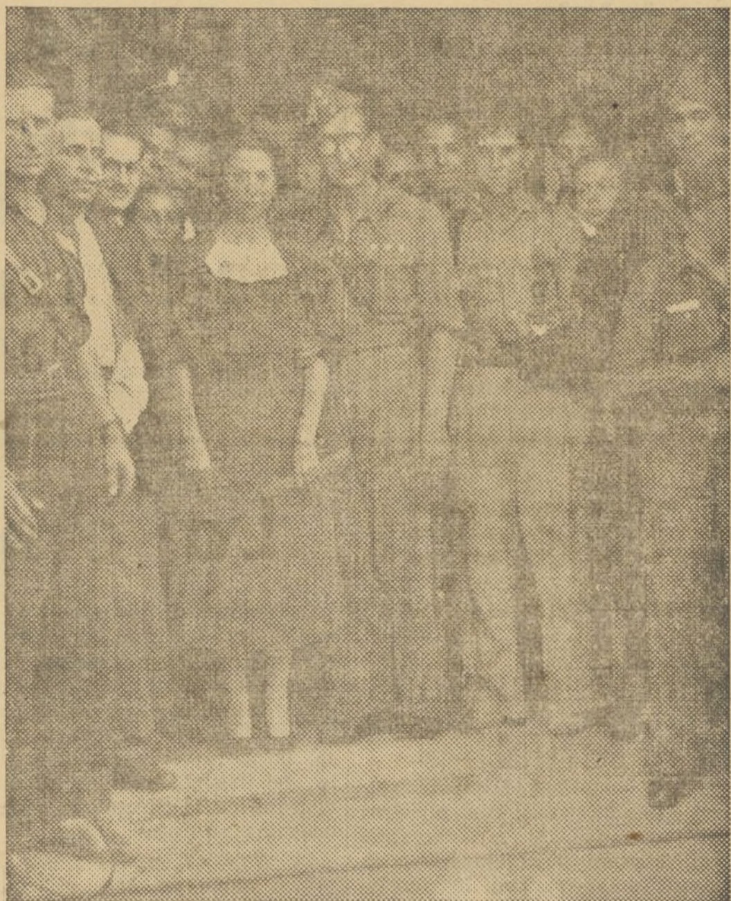
LOS RECIEN CASADOS SALIENDO DEL PALACIO DE JUSTICIA, EN UNION DE LOS TESTIGOS E INVITADOS A LA CEREMONIA

Terminada la ceremonia, los recién casados partieron en dirección a Madrid, después de recibir