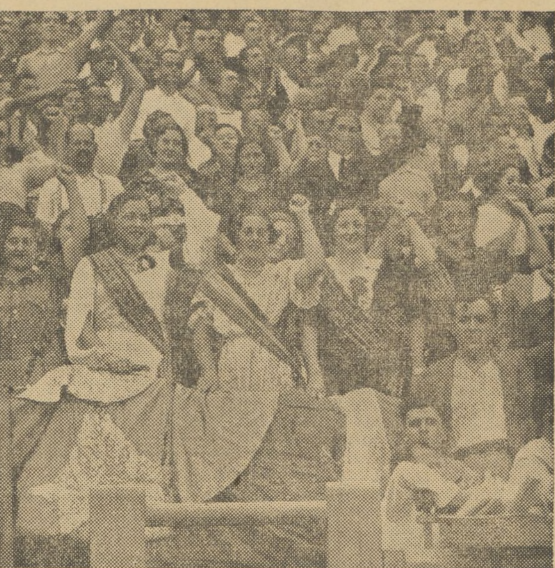
LAS BELLEZAS FALLERAS QUE PRESIDIERON, ACLAMADAS POR EL PUBLICO