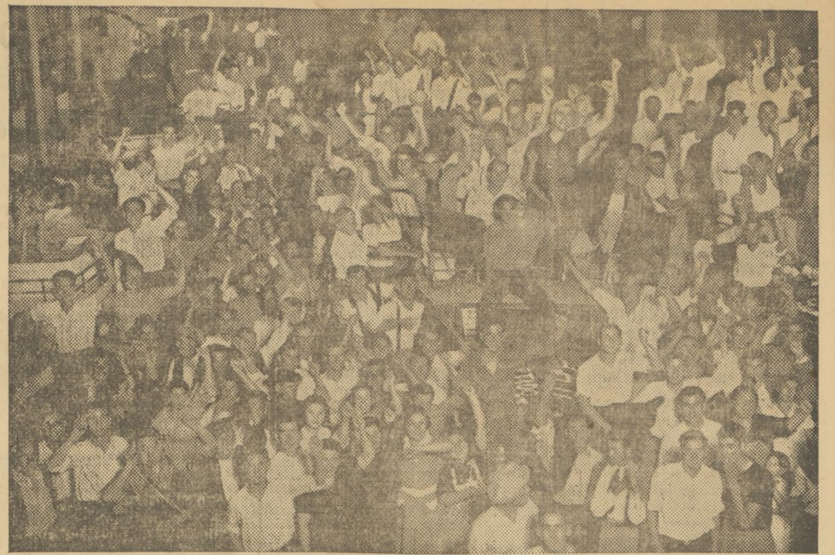
EL PUBLICO DESPIDIENDO A LOS CONDUCTORES Y MILICIANOS DE LOS 50 CAMIONES QUE SE REMITIERAN AL FRENTE

GUARDAPOLVOS Los mejores : Barato de Greda