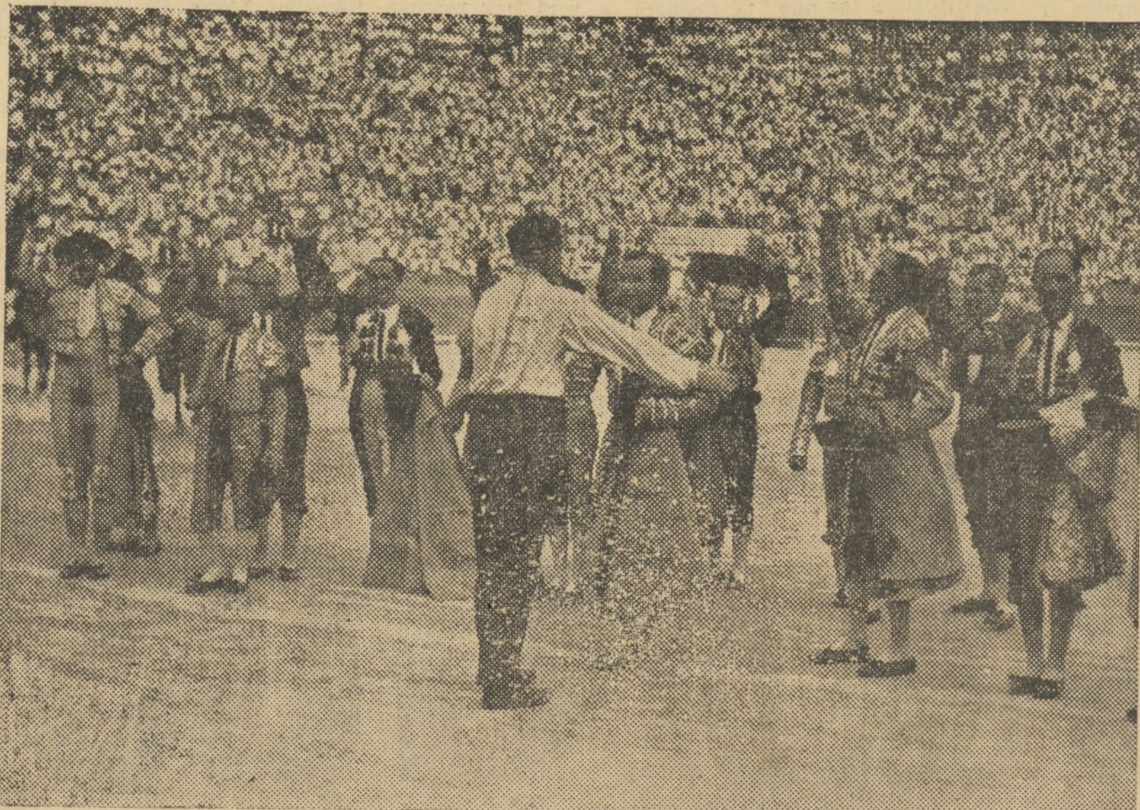
LLAPISERA Y LOS TOREROS, MIENTRAS LES ACLAMA EL PUEBLO, EN ABRAZO FRATERNAL TRAS EL PASEILLO