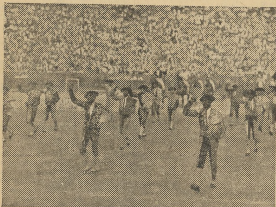
LAS CUADRILLAS DURANTE EL PASEILLO, TODOS PUÑO EN ALTO

Todo contribuyó a la victoria, y la España se dividió en dos bandos tan bien definidos, que a unos se les llamaba «negros» y a otros «blancos». Y aquí voy a parar; hasta nuestra fiesta hubo de allanarse en un campo u otro... y se llamaron «negros» muy pocos toreros.