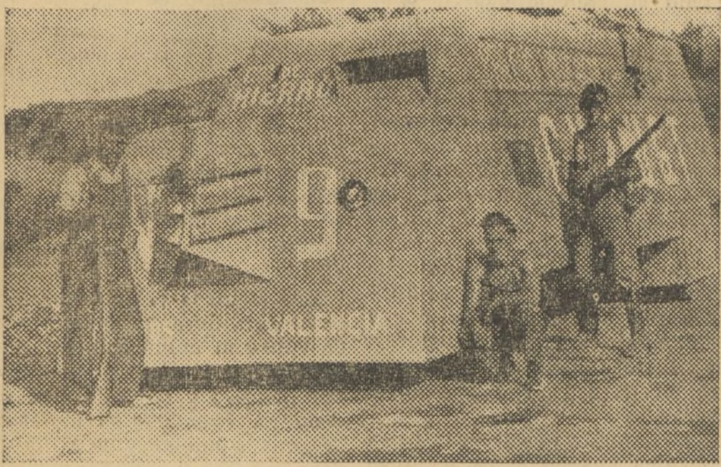
EL CAMION BLINDADO PANTO VILLA, EN MEMORIA DEL BRAVO MILICIANO QUE CAYO VICTIMA DE LA TRAICION ENEMIGA

aventajar en salvajismo a los "angelitos" del Tercio! La canalla fascista de España puede, pues, poner cátedra de fofajidos y villanos.