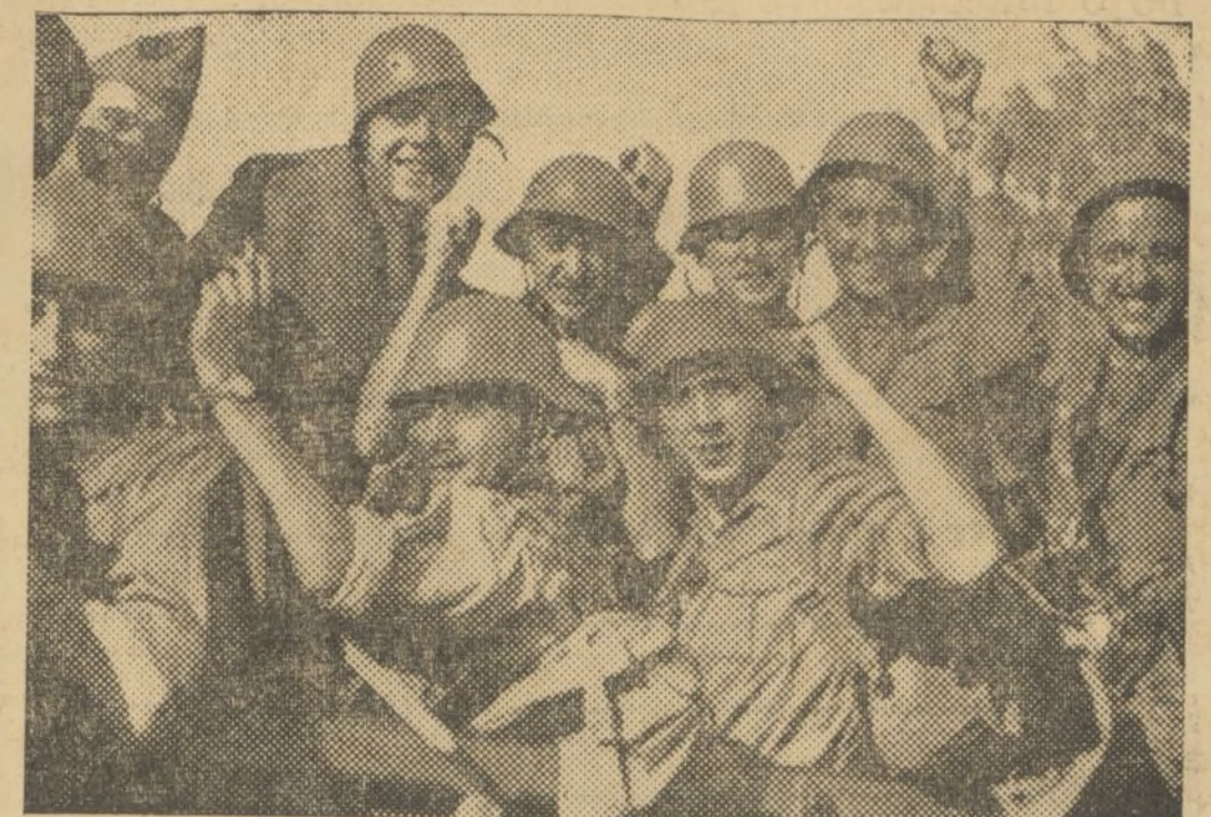
PREPARATIVOS PARA EL ASALTO A TERUEL. — TROPAS DE ARTILLERIA SALEN HACIA LAS LINEAS DE FUEGO

¡Cumplid con vuestro deber! El Comité Nacional de C. N. T.,