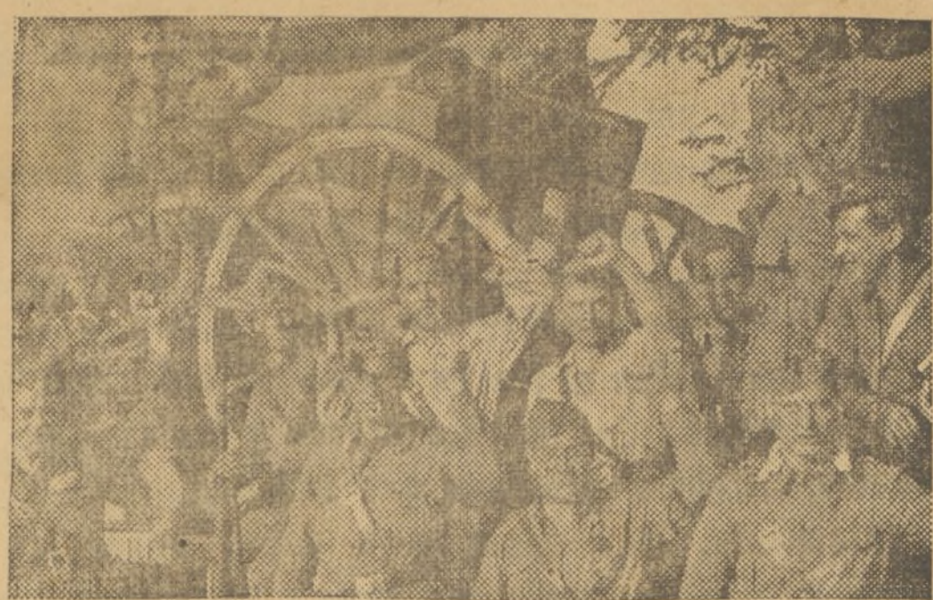
LAS FUERZAS Y ARMOS SON LLEVADOS A LAS AVANZADAS EN CAMIONES PARA GANAR TIEMPO