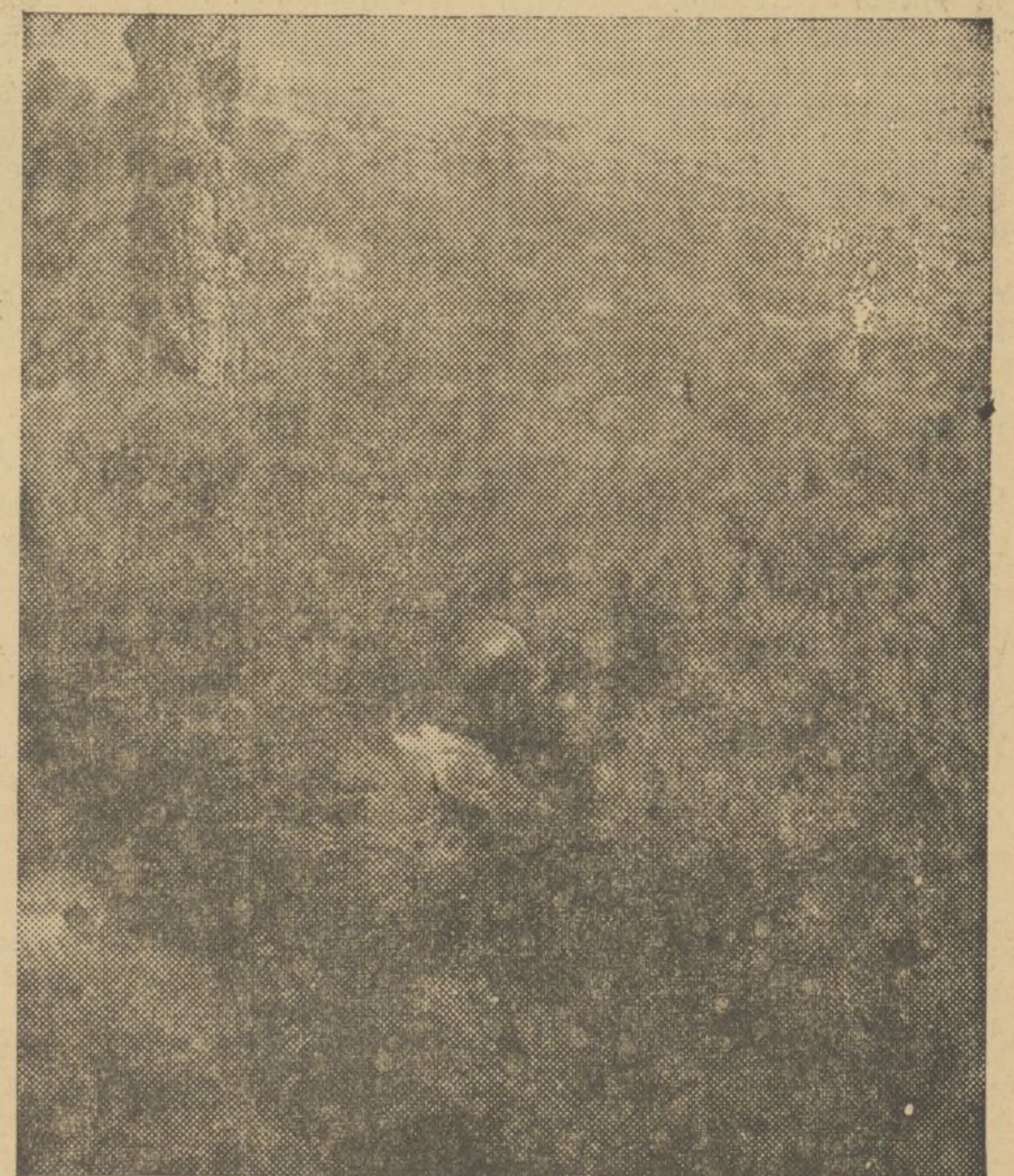
PARAPETADO TRAS UNOS MATORRALES ESTE TIRADOR «PAQUEA» A LOS FACCIOSOS