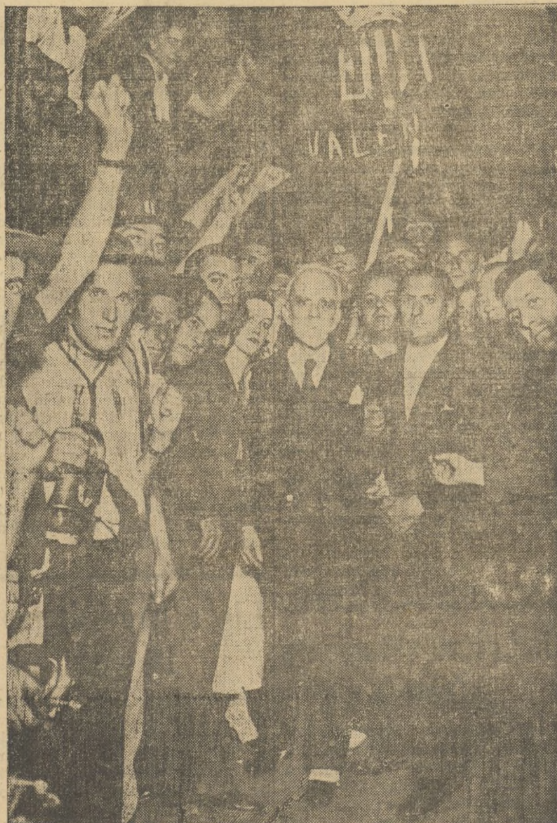
EL PUEBLO VALENCIANO ACLAMA AL ILUSTRE PRESIDENTE DE LA REPUBLICA PORTUGUESA, DON BERNARDINO MACHADO, A SU LLEGADA A NUESTRA CIUDAD, TRIBUTANDO UN ENTUSIASTA HOMENAJE DE CALIDA Y FERVIENTE SIMPATIA

Sea bienvenido a nuestra ciudad tan destacado huésped, así como sus hijas, deseándoles que su estancia en Valencia les sea grata.