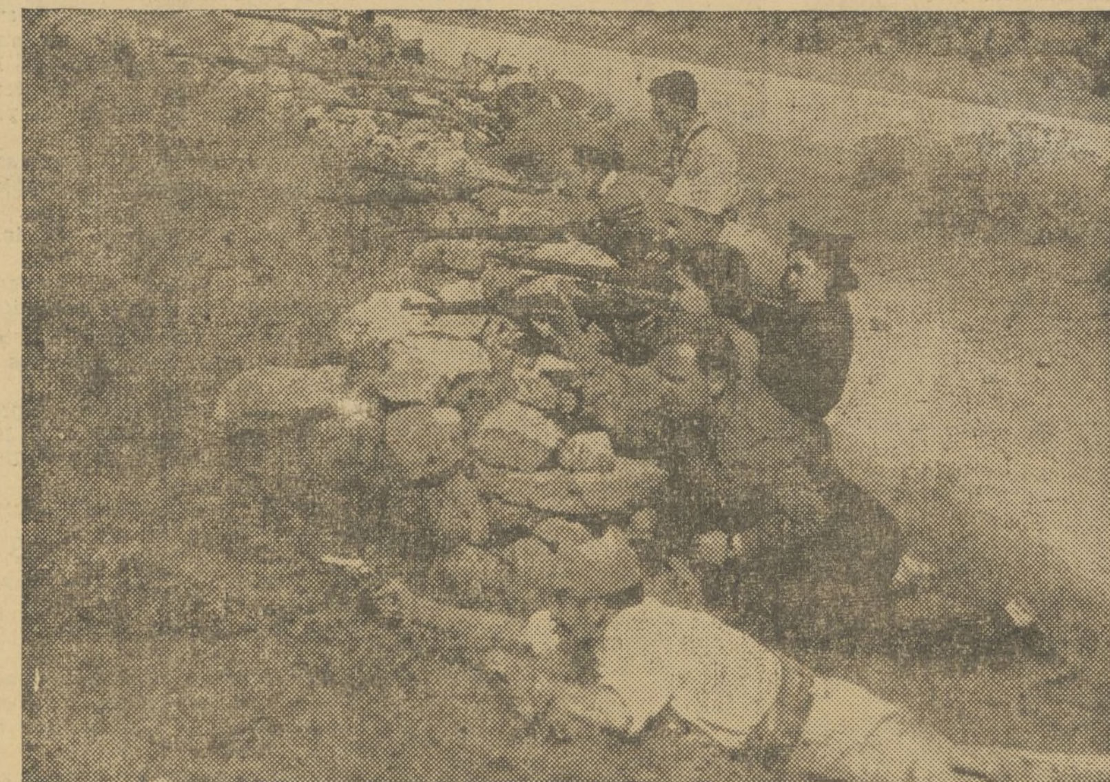
EL ENEMIGO NO ESTA MUY DISTANTE. LA VICTORIA PROXIMA. CON ESTA ILUSION LUCHAN LOS MILICIANOS

En la plaza del pueblo los grupos se animan en conversaciones, llevadas en voz alta, a gritos; junto a la pared de la que fué iglesia, unos muchachos del pueblo, milicianos otros, descansan del esfuerzo franco realizado hasta que se extinguió por completo la llamada vespertina, jugando a pelota con idéntico ardor al que emplean para disparar sobre el enemigo parapetado en las montañas de Villastar; en la fuente, las mujeres del pueblo, comentan gozosas cómo va volviendo la normalidad en muchos hogares y cómo retornan de su éxodo por las montañas muchos que huyeron al llegar los rebeldes; los músicos,